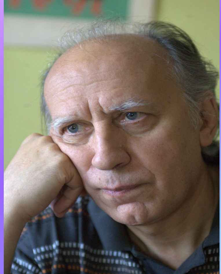
Valentin Silvestrov

Валентин Сильвестров підтримував акції протесту в Києві 2004 і 2013-14 років, що пояснював так: «Я все ж таки, як і будь-яка інша творча людина, більше індивідуаліст по своїй природі. Але настає такий момент, коли просто неможливо не вийти. Коли так відверто доводять людей своїми мерзенними діями, притому глобально, що виникає таке обурення, що ти буквально втрачаєш розум...» При цьому чинну владу характеризував як "підлоту":