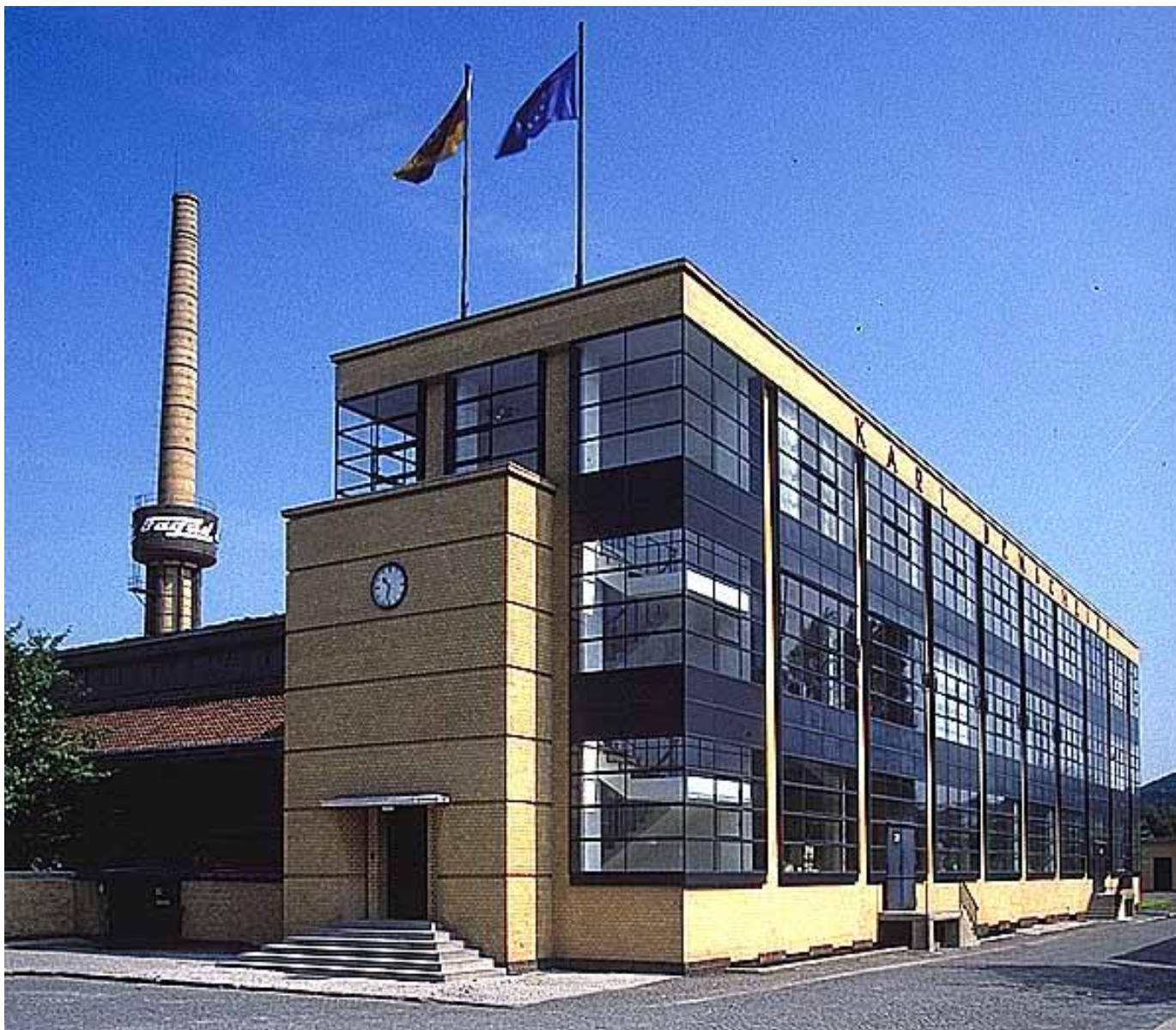
Здание обувной фабрики «Фагус»