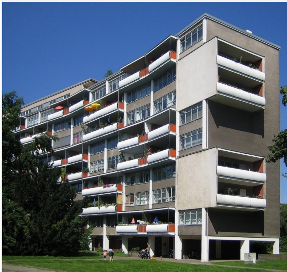
жилой дом в Ганзе, 1950-е