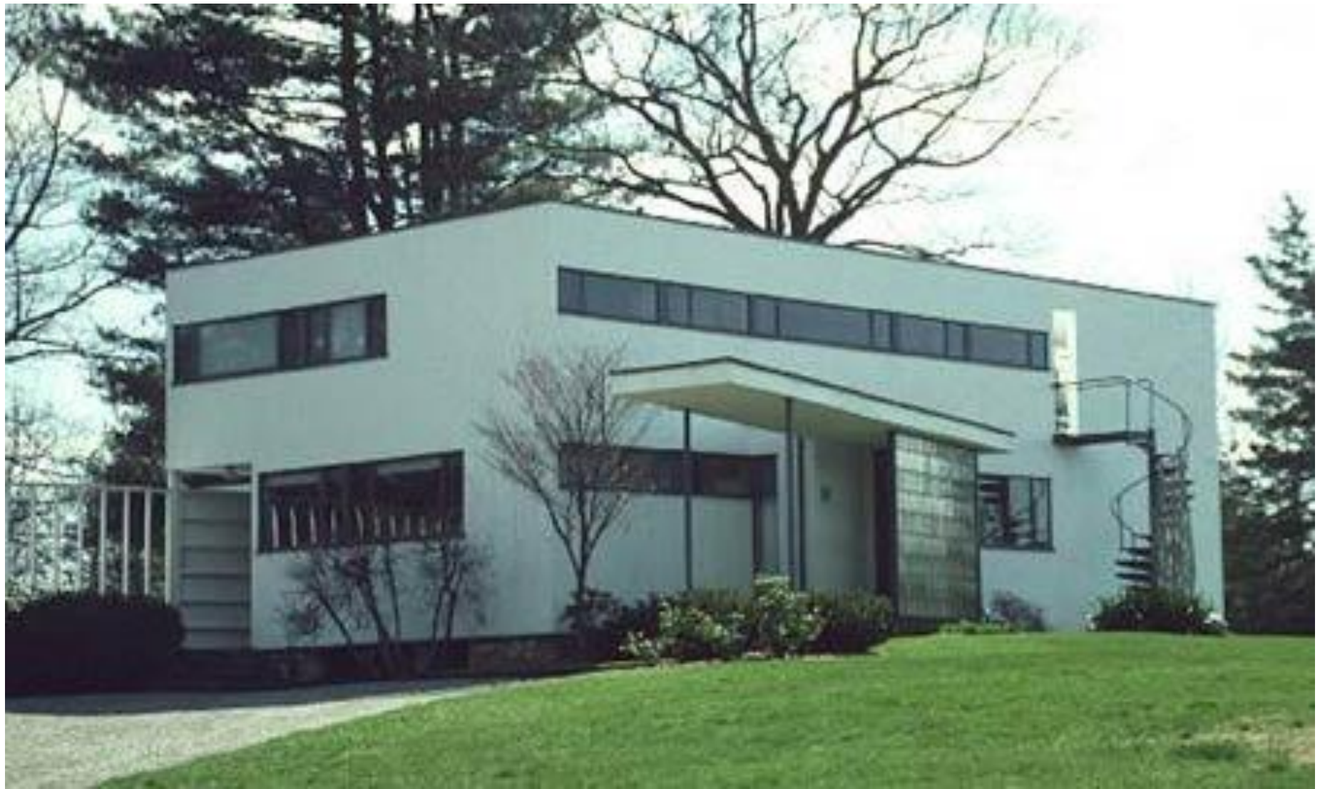
Дом Вальтера Гропиуса в Линкольне