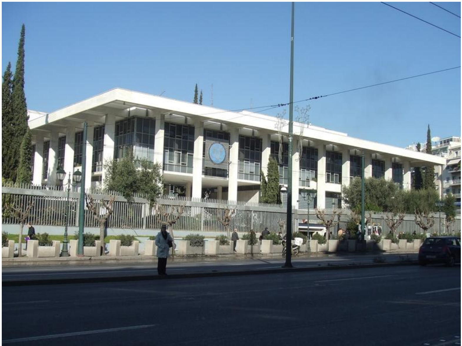
Здание американского посольства в Афинах (1956—1961)