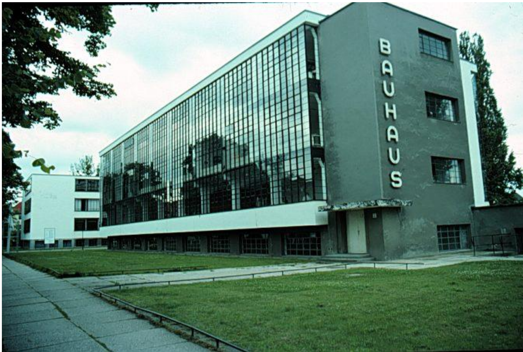
«Баухауз» (нем. «дом строительства») — высшее архитектурное и художественно-промышленное училище.