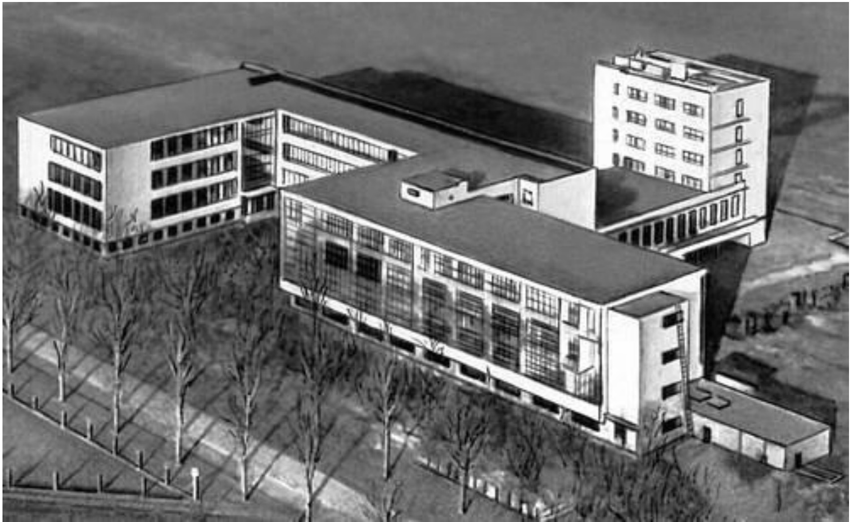
Комплекс «Баухауза» в Дессау. 1925—26.