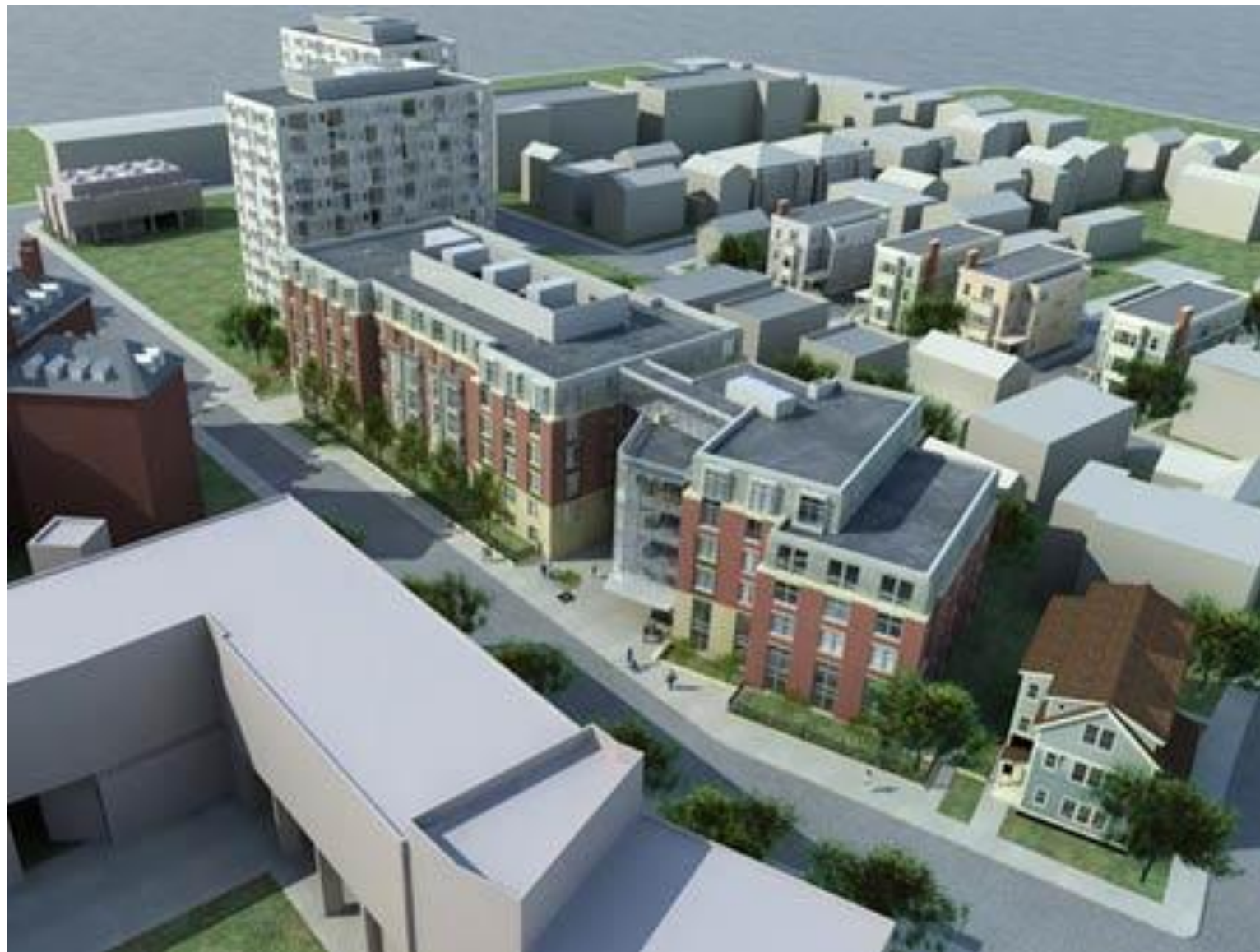
Комплексы учебных зданий Гарвардского университета (1949-50)