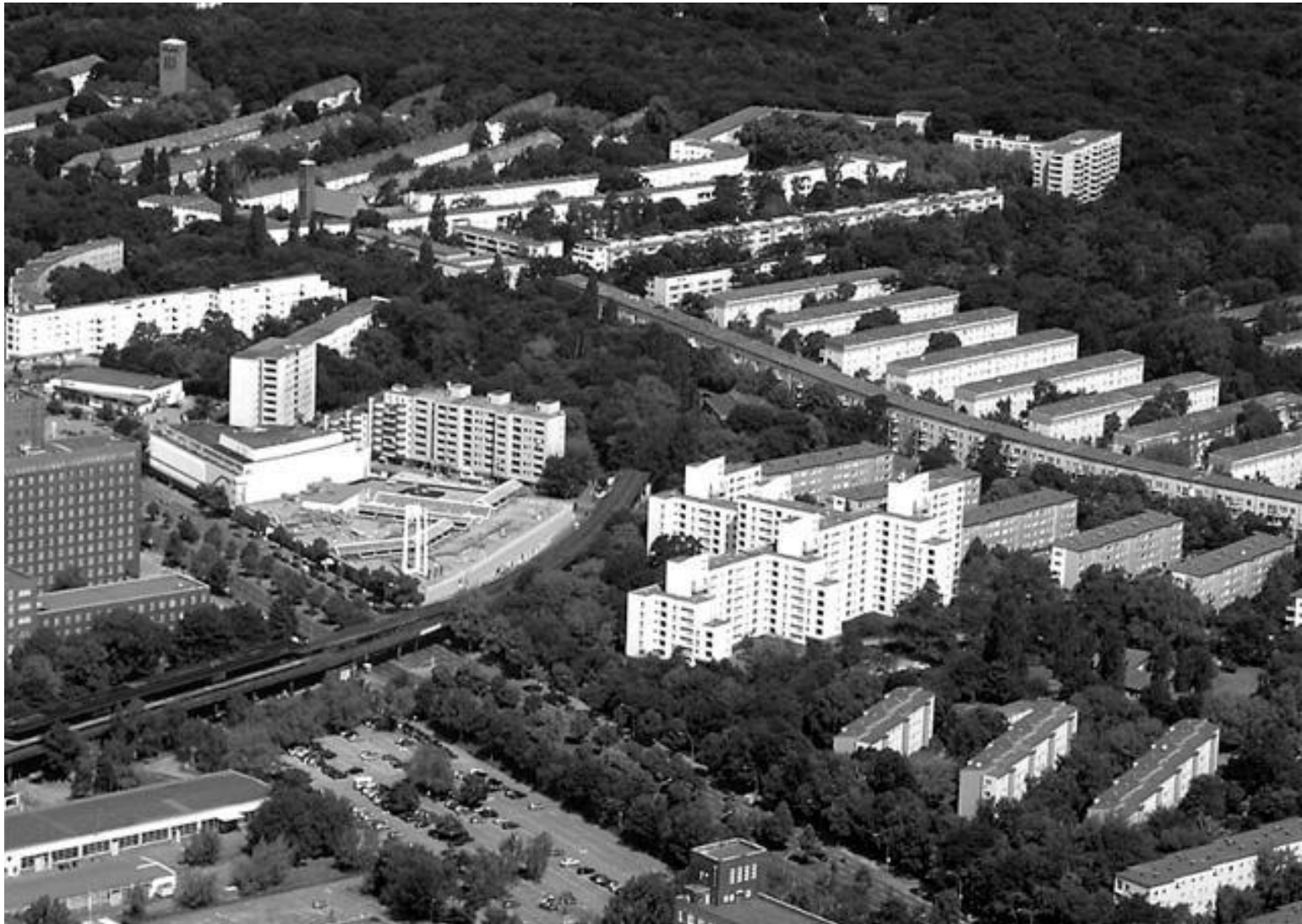
Жилой комплекс Сименсштадт на окраине Берлина