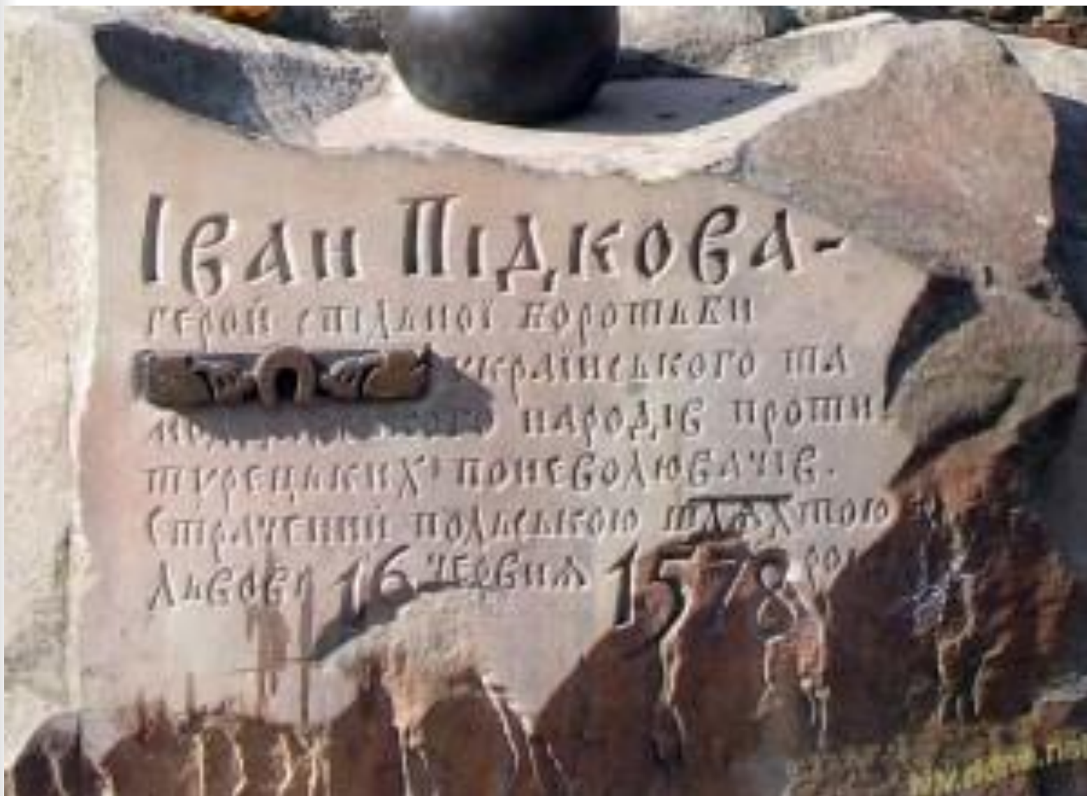
Місце страти Івана Підкови у Львові