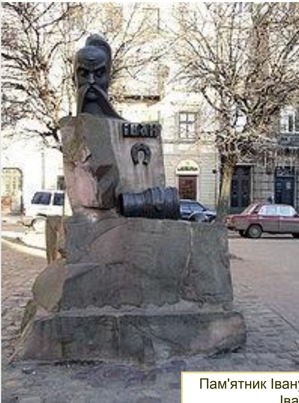
Пам'ятник Івану Підкові, Львів, площа Івана Підкови