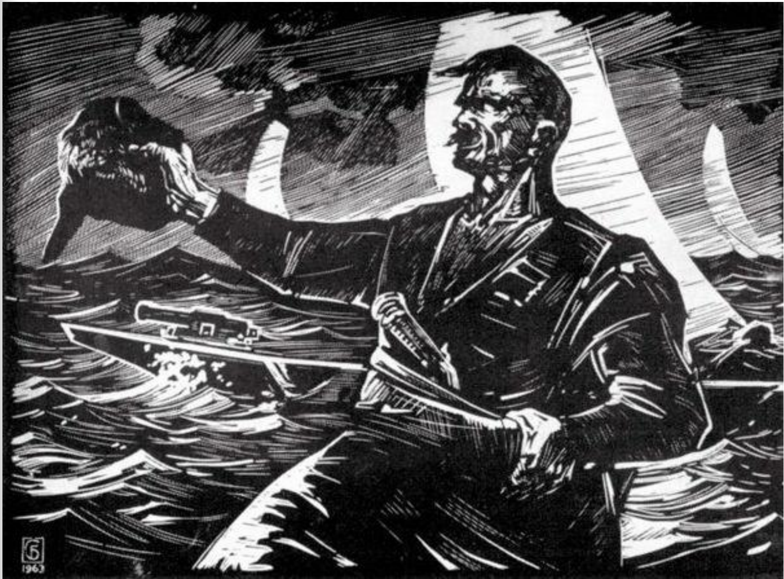
Промова Івана Підкови