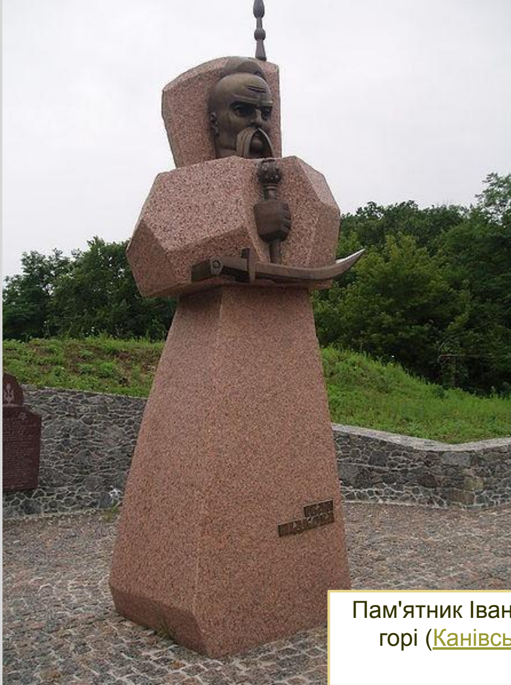
Пам'ятник Іванові Підкові на Тарасовій горі ( Канівський район , Черкаська область )