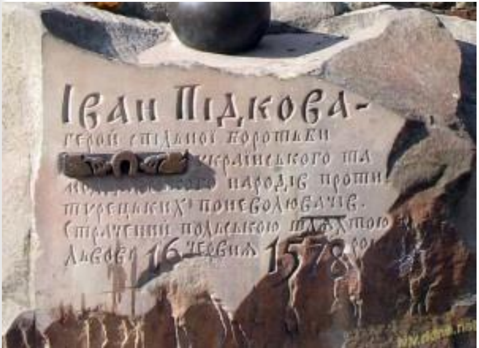
Місце страти Івана Підкови у Львові