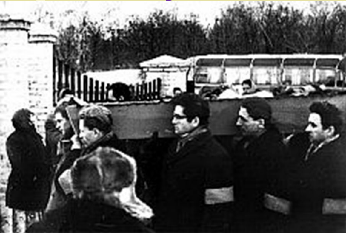
Похорон Василя Симоненка

У 1963 році Симоненко був жорстоко побитий кагебістами на залізничній станції Шевченка у місті Смілі, після чого він переніс відмову нирок і невдовзі помер у головній обласній лікарні 13 грудня 1963 року. Похований в Черкасах.