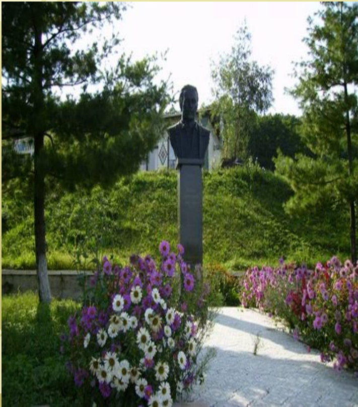
Пам'ятник Василеві Симоненку біля садиби в Біївцях

Василь Симоненко народився 8 січня 1935 року в селі Біївці Лубненського району на Полтавщині.