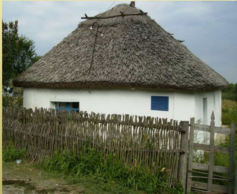
Хата, у якій народився Василь. Село Біївці Лубненського району