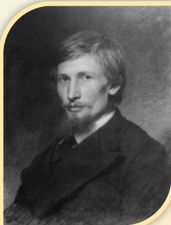
Портрет Васнецова В.М.