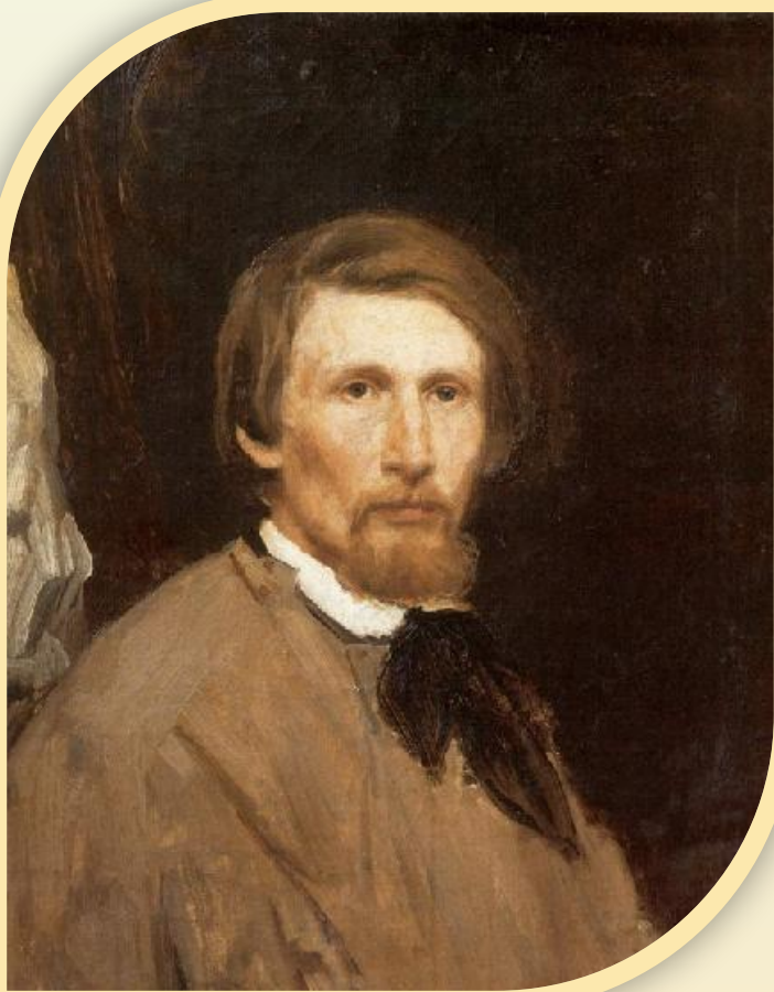
Автопортрет. 1873 Государственная Третьяковская галерея

Холодный Вятский край с его суровой природой, обособленным укладом жизни, сохранившим старинные обычаи, народные поверья, деревенские песни и сказки, сформировал художественное и жизненное мировоззрение будущего живописца. Виктор и его младший брат Аполлинарий (пошедший впоследствии по стопам брата) навсегда впитали в себя эту атмосферу «преданий старины глубокой», которая в дальнейшем явилась главной особенностью их творчества. Но по сложившейся семейной традиции мальчики Васнецовы должны были пойти по стопам своих предков и стать священниками.