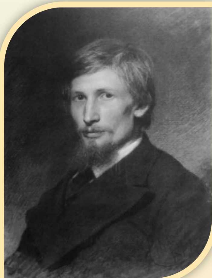
Портрет Васнецова В.М.