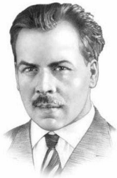
ВАВИЛОВ Николай Иванович 1887-1943

“мне не жалко отдать жизнь ради самого малого в науке”