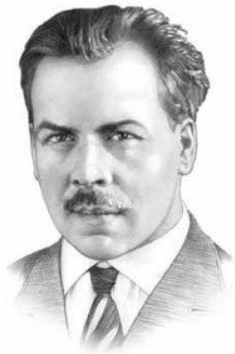
ВАВИЛОВ Николай Иванович 1887-1943

“мне не жалко отдать жизнь ради самого малого в науке”