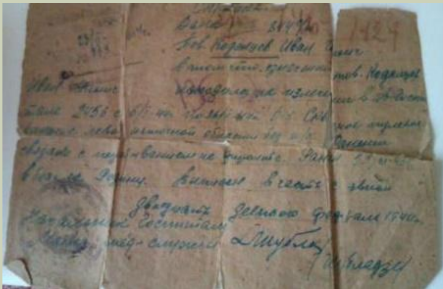
Справка из госпиталя

При жизни папа мне ничего не рассказывал. Почему? Я думаю, что была мала (его не стало, когда мне было 16 лет), да и тяжелы были воспоминания. Он не носил медали. Он не хвастался геройством. Однажды он сказал, что если кто скажет мне, что на войне не страшно, не верить тому человеку. «Запомни, дочь, на войне страшно и даже очень». Это говорил человек 60-ти лет, который в 18 лет принял Присягу, в 20 лет получил медаль «За отвагу», и в 20 лет был представлен к ордену Красной Звезды. Страшно представить, что он пережил, и переживали такие же, как он на войне. Но всё равно - эти парни-герои - они защищали Родину!