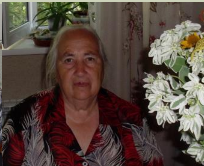
80-летие мамы! 2014 год