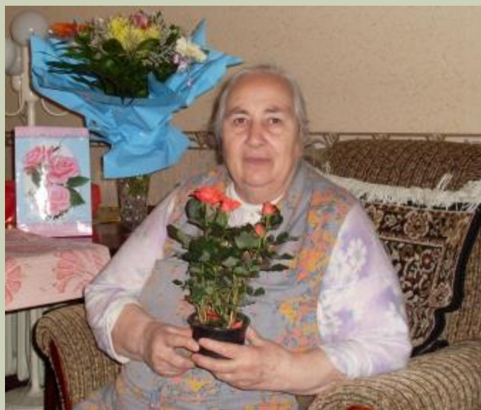
2008 и 2010 годы