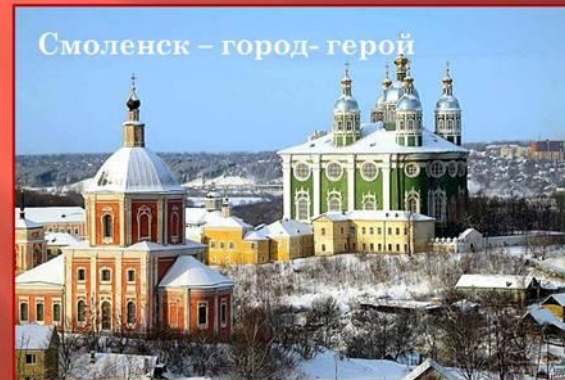
Смоленск – город-герой