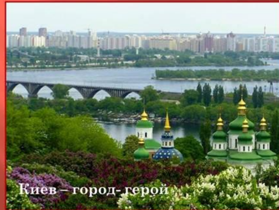
Киев – город-герой