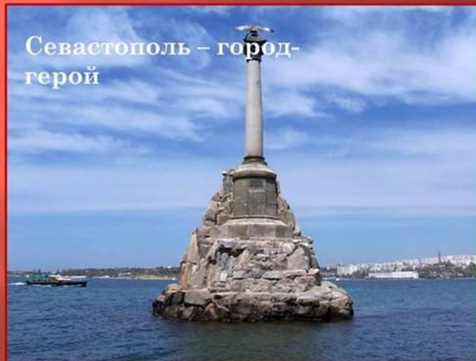
Севастополь – город-герой