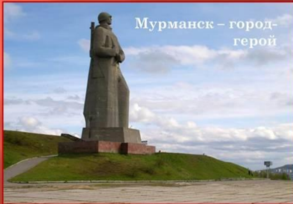
Мурманск – город-герой