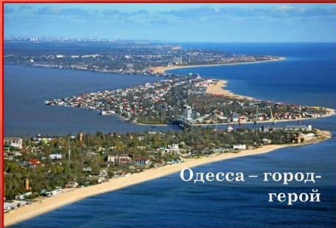
Одесса – город-герой