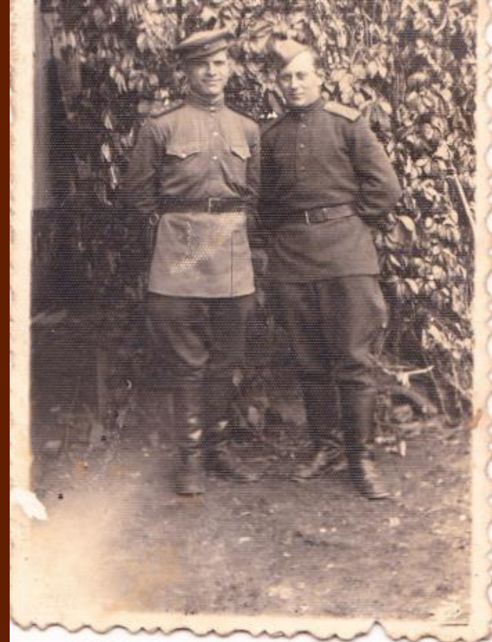
Слева мой прадедушка со своим другом