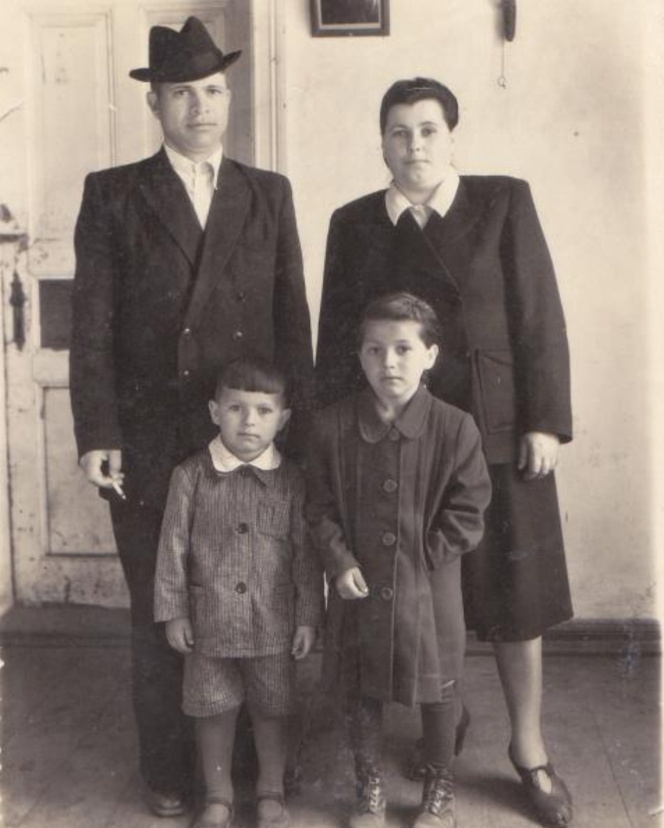
Мои прабабушка и прадедушка со своими детьми после войны