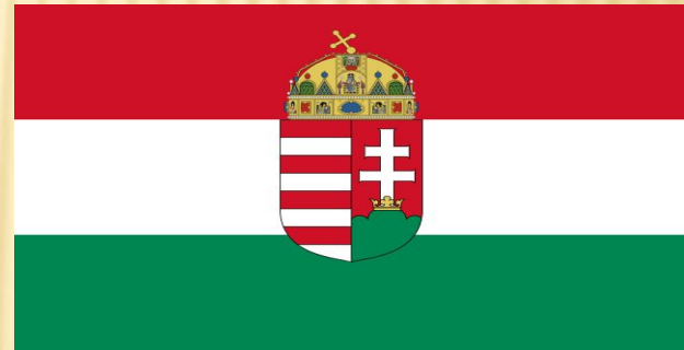
Флаг и Герб