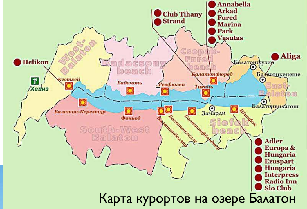
Карта курортов на озере Балатон