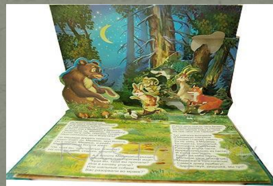
Книжка - театр