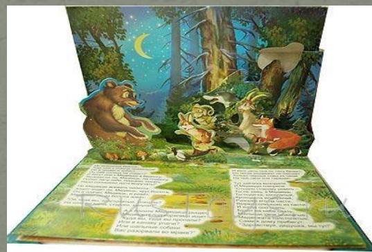
Книжка - театр