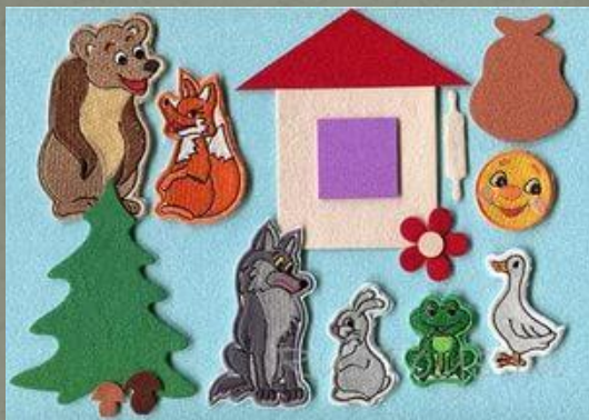
Театр на фланелеграфе