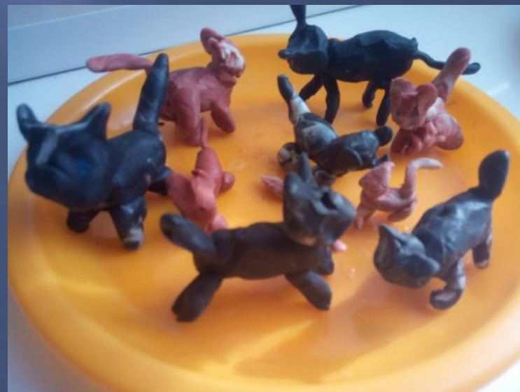
Лепка «Кошка с котёнком»