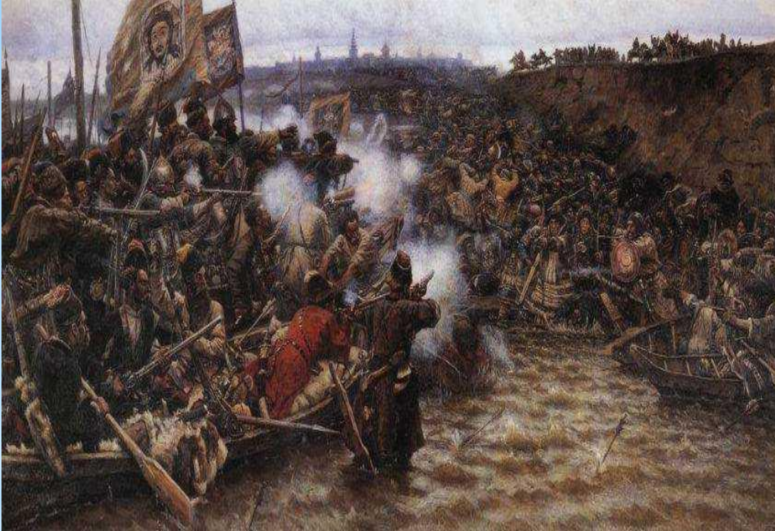
Підкорення Сибіру Єрмаком. 1895 р

У Москві Суриков почав нову картину - "Підкорення Сибіру Єрмаком" (1895, Російський музей). Вона так само, як і Бояриня Морозова, вимагала багато часу, пошуків композиції, відповідної натури і такого напруженої праці, який виключав будь-яку можливість іншої скільки-небудь серйозної роботи.