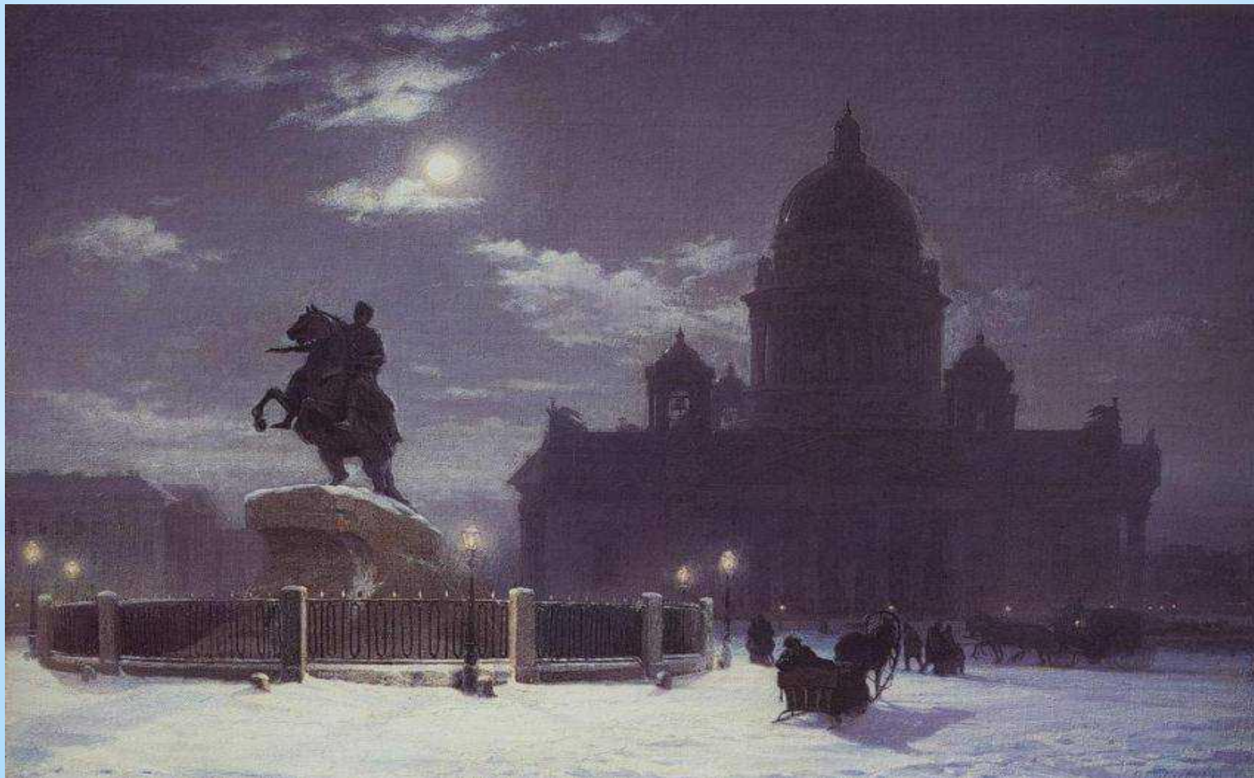
Вид пам'ятника Петру I на Сенатській площі в Петербурзі 1870р