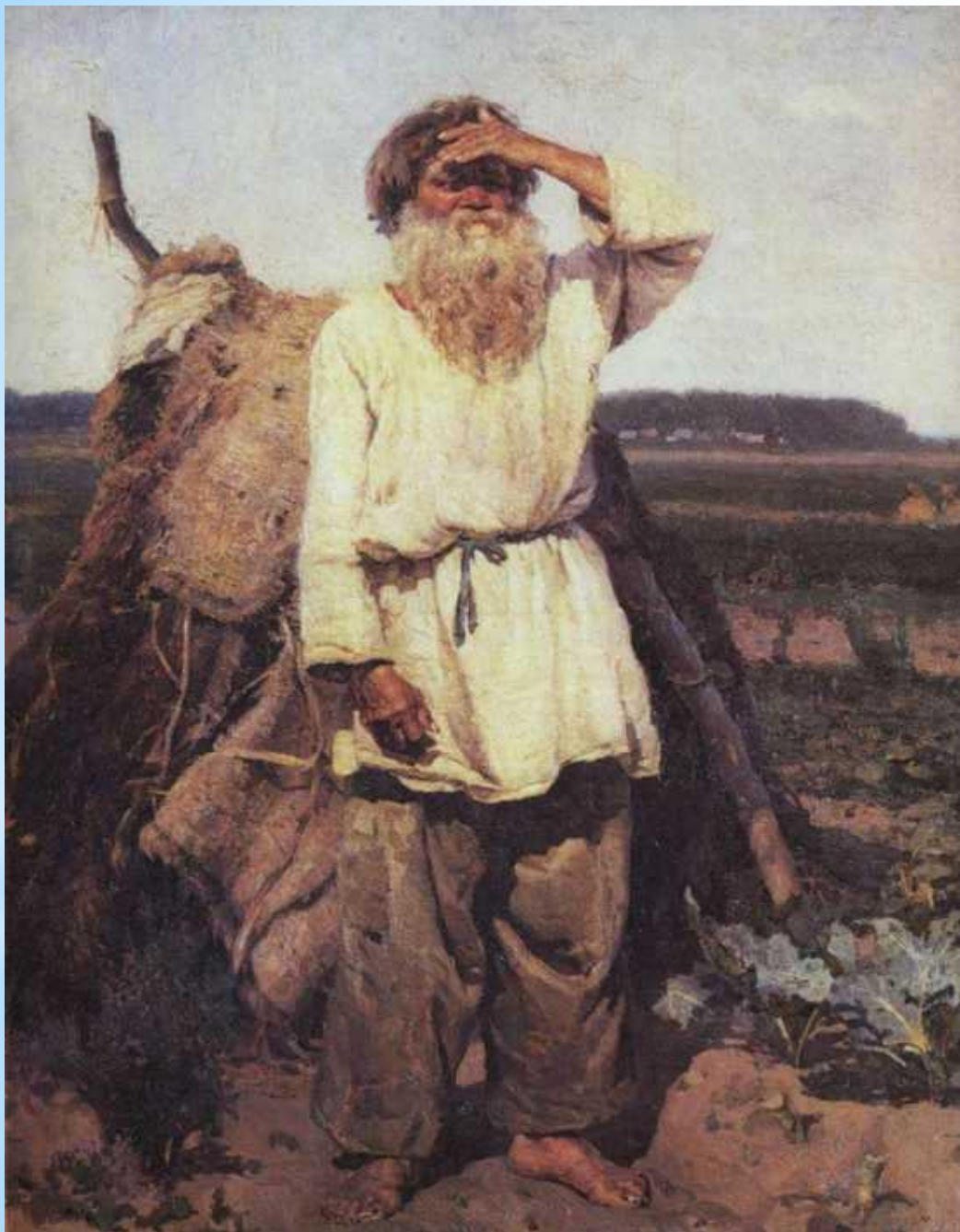
* Старик-огородник 1882р