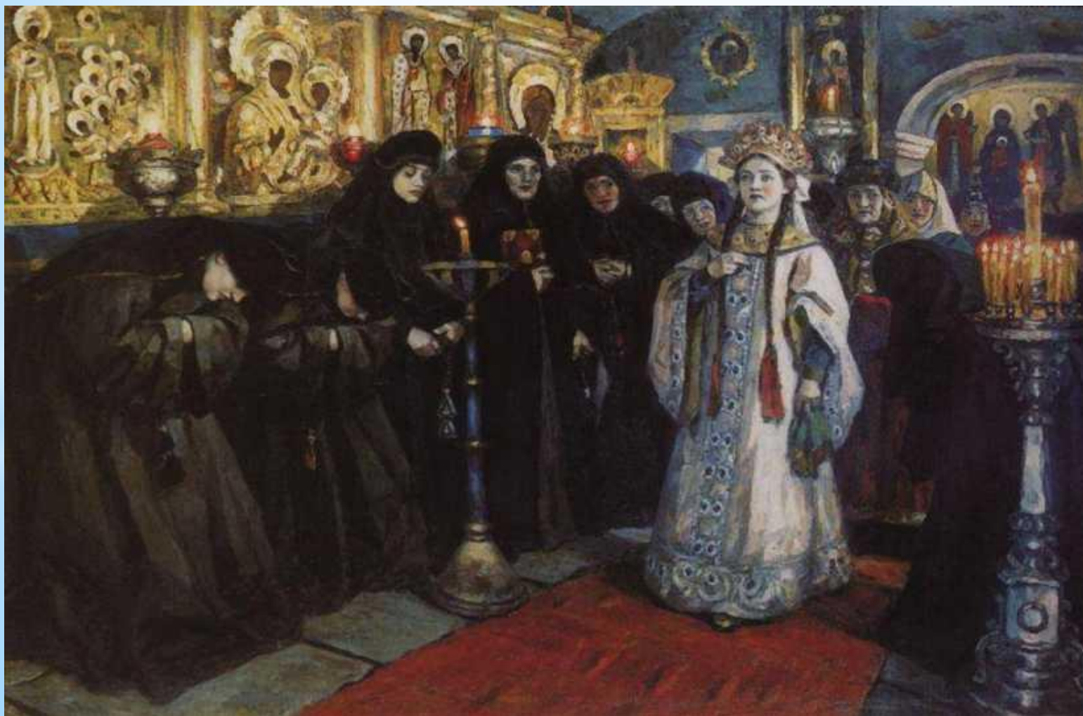
Відвідування царівною жіночого монастиря 1912р

"Жіноче царство" востаннє стало предметом живописних образів у картині "Відвідування царівною жіночого монастиря" (Третьяковська галерея). Суриков працював над картиною особливо старанно в 1898 році, але виставив її тільки в 1912 році. Ця картина за змістом своїм швидше історико-побутова, ніж чисто історична, подібна творчості С. Іванова та А. Рябушкина.