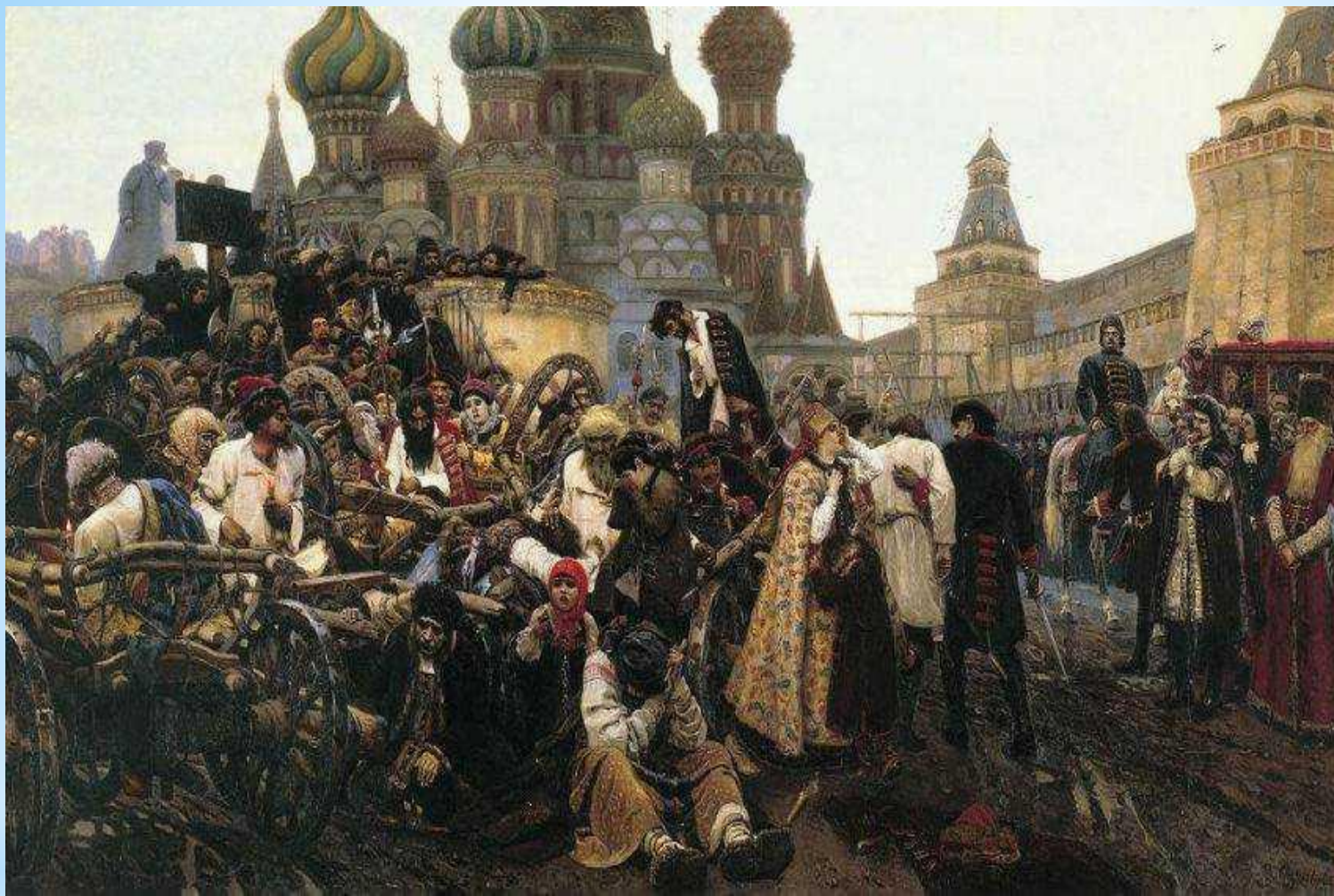
Ранок стрілецької страсти "- грандіозна картина, завершена в 1881р (Третьяковська галерея)

Обравши сюжетом фінальний епізод останнього стрілецького бунту 1698 - страта заколотників на Червоній площі під особистим наглядом Петра I - Суриков показує народне протидія царським реформам зверху. При цьому протистояння народу і царя - або ж, у ще більш масштабному плані, російського середньовіччя і ранніх рубежів російської нової історії - явлено у вигляді монументальної трагедії, причому трагедії, де жодна зі сторін не залишається переможцем, взаємно засвідчуючи про нерозв'язності конфлікту.