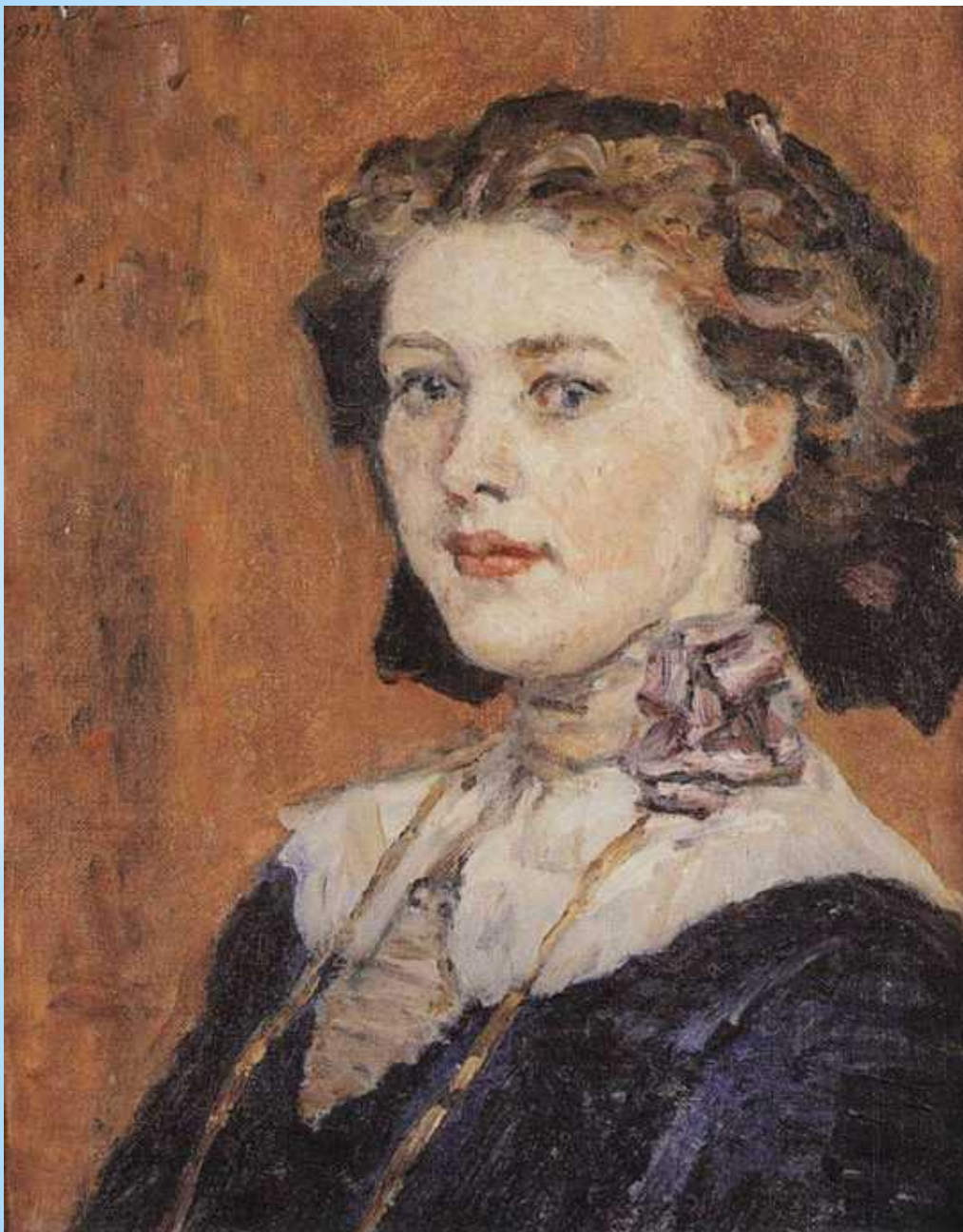
Портрет молодої жінки. 1911р