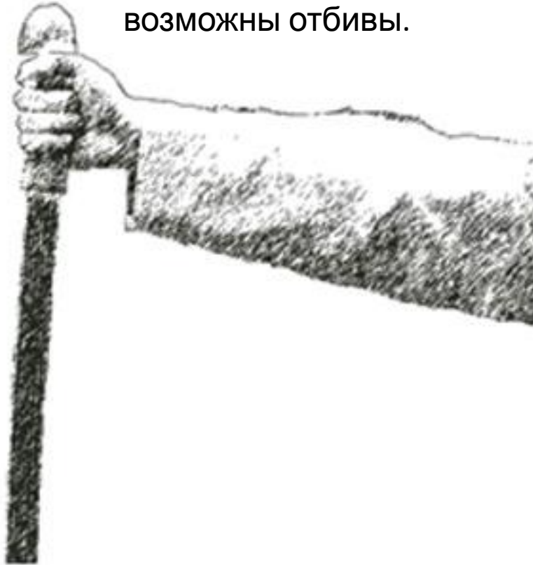
Рис. 20. Обратный хват шашки

Во время перехватов и джигитовки шашкой образуется обратный хват шашки (рис. 20). Этот хват хорош при нанесении режущих ударов в плотном бою, при уверенном владении клинком возможны отбивы.