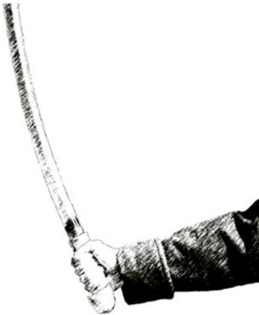
Рис. 16. Обычный хват шашки

Первый хват шашки – обычный обхват рукояти, всеми пальцами (рис. 16). В этом случае положение шашки следует признать более выгодным для производства режущего удара, так как направление руки от локтя до кисти составит с направлением оружия (в одной и той же плоскости) тупой, приближающийся к прямому, угол, вследствие чего при круговом движении выпрямленной на ударе руки клинок придется к точке цели под углом меньше прямого, механически производя режущее движение. Но при этом оружие не готово ни к производству уколов, ни отбивов. Этот способ используется также в том случае, если оружие имеет значительный вес.