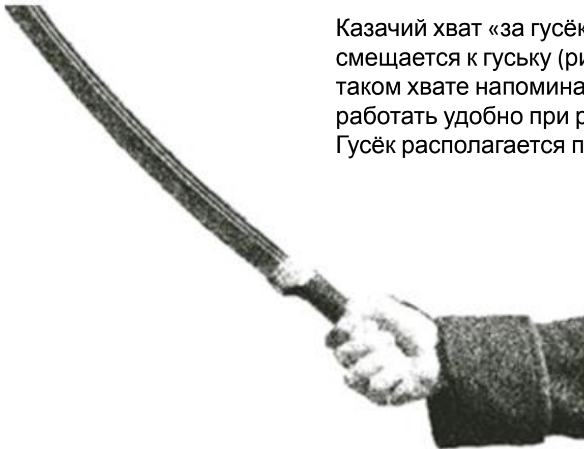
Рис. 18. Казачий хват «за гусёк»

Казачий хват «за гусёк» – ладонь смещается к гуську (рис. 18). Шашка при таком хвате напоминает шарнир, работать удобно при рубке с потягом. Гусёк располагается плотно в ладони.