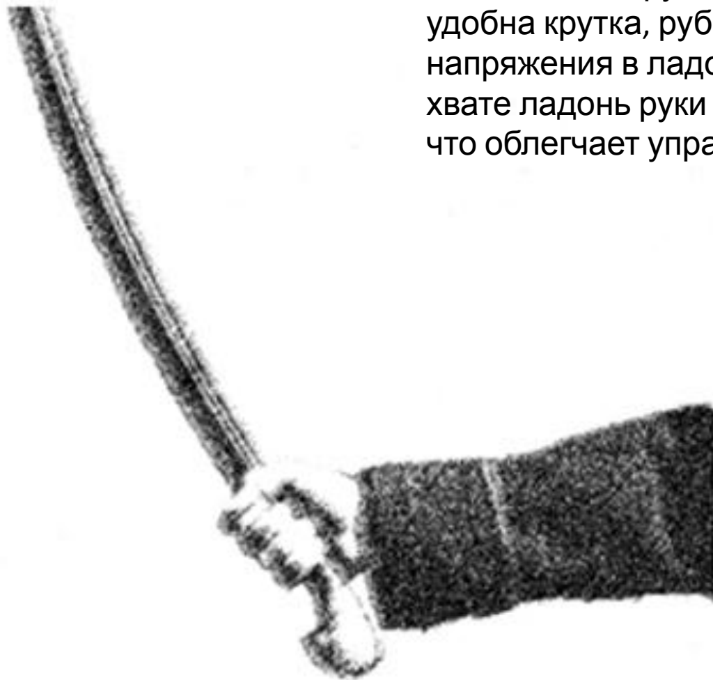
Рис. 17. Черкесский хват шашки

Второй хват (черкесский) – ладонь смещается к нижней части рукояти (рис. 17). При таком хвате удобна крутка, рубка требует варьирования напряжения в ладони при ударах. При этом хвате ладонь руки смещается к центру тяжести, что облегчает управление оружием.