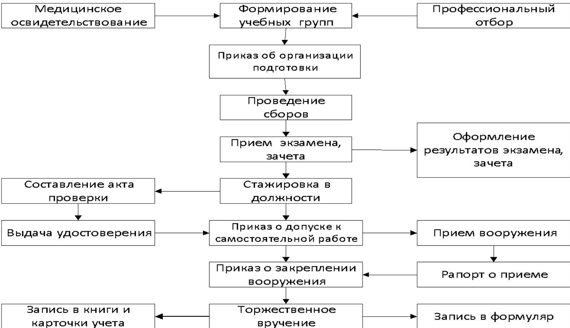
Схема допуска личного состава к эксплуатации