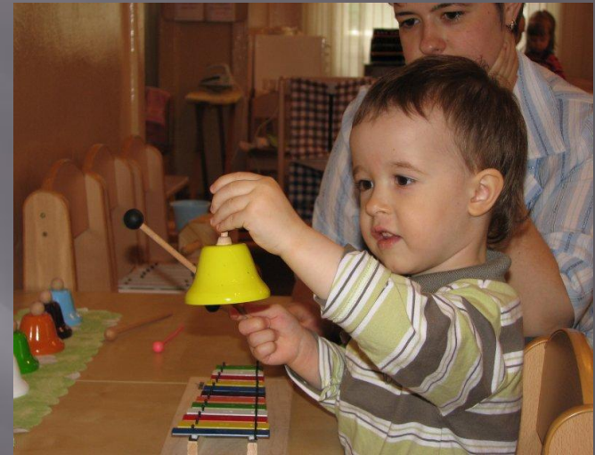
Игра на музыкальных инструментах