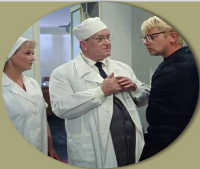
ПРИНУДИТЕЛЬНЫЕ МЕРЫ МЕДИЦИНСКОГО ХАРАКТЕРА