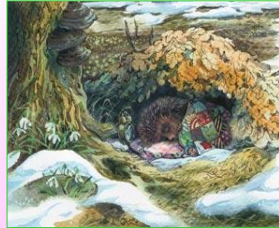
«Ручей забрался в постельку ежа».