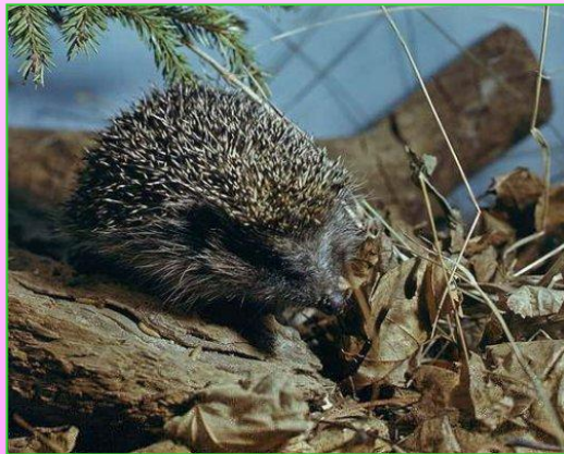
«Ёж выбрался из убежища».