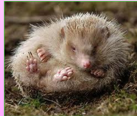
«Ёж подставил солнышку своё брюшко».