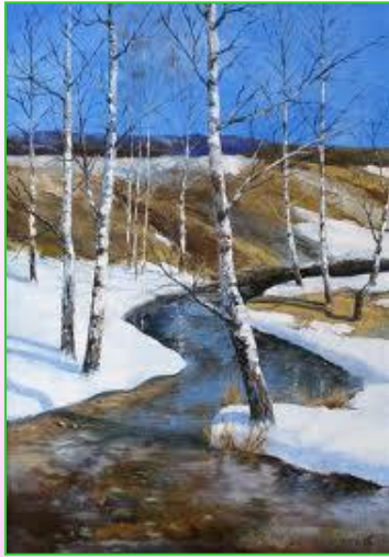
«По ложбинке побежал ручей».