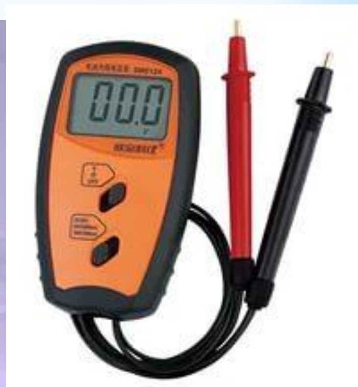
Рис. 23 - Омметр