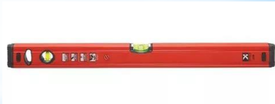
Рис. 4 - Уровень