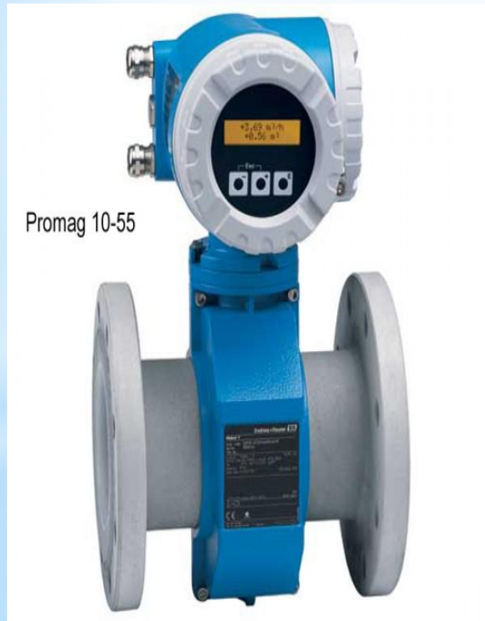
Рис. 26 - Счетчик

СИ: расходомеры, счетчики, дозаторы, меры вместимости