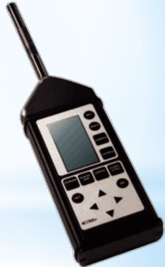
Рис. 21 - Виброметр