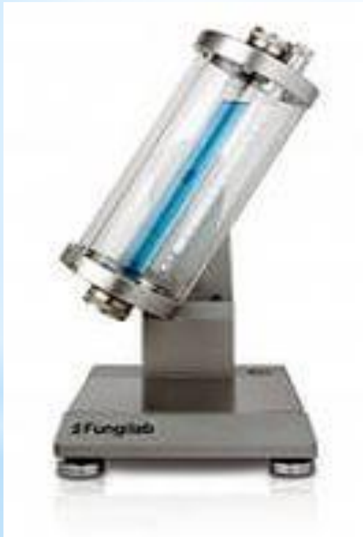
Рис. 12 - Вискозиметр

СИ: вискозиметры, дуктилометры, пенетрометры