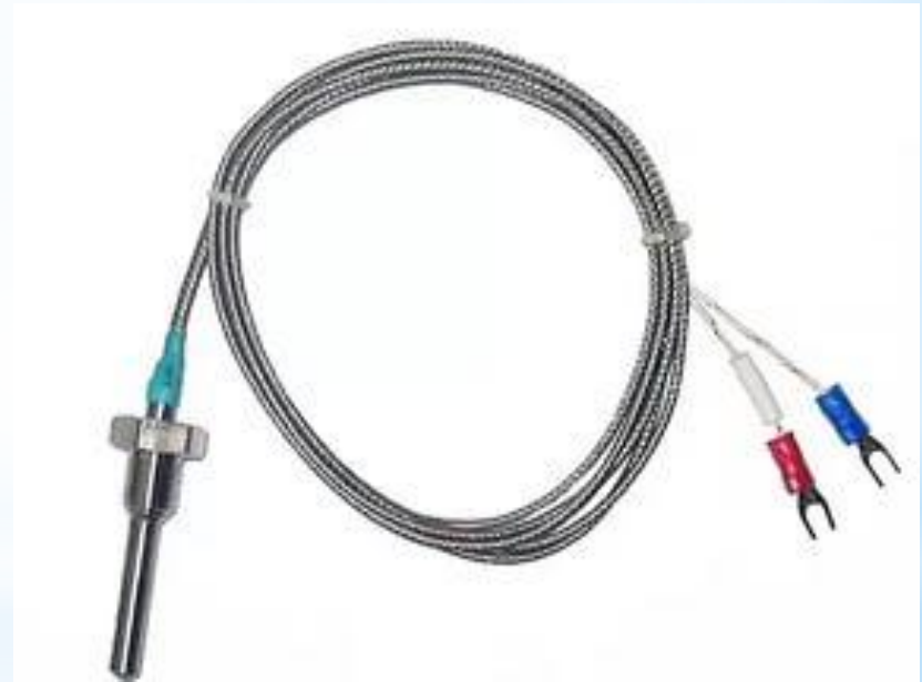
Рис. 15 - Термопара