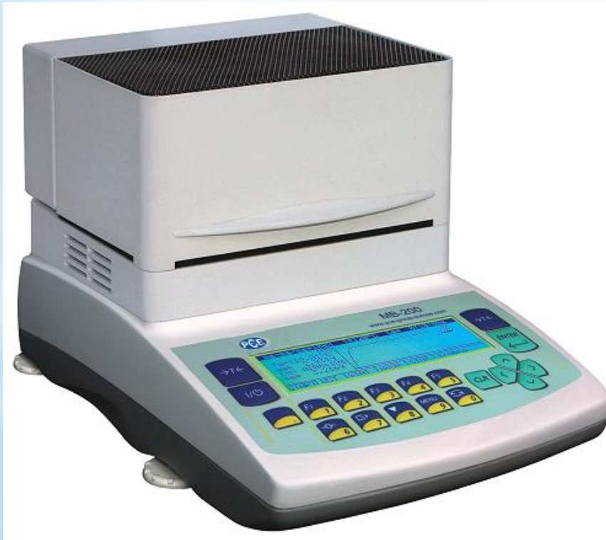
Рис. 18 - Влагомер

СИ: влагомеры, психрометры, рефрактометры, поляризационные микроскопы