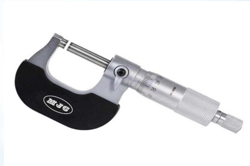
Рис. 2 - Микрометр