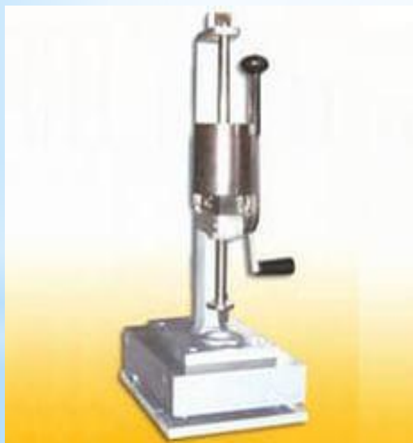
Рис. 7 - Твердомер

СИ: прессы, копры, динамометры, твердомеры, силоизмерительные машины, склерометры