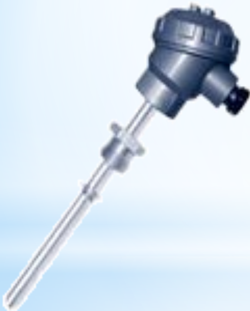
Рис. 14 - Термометр сопротивления

СИ: термометры ртутные и сопротивления, термопары