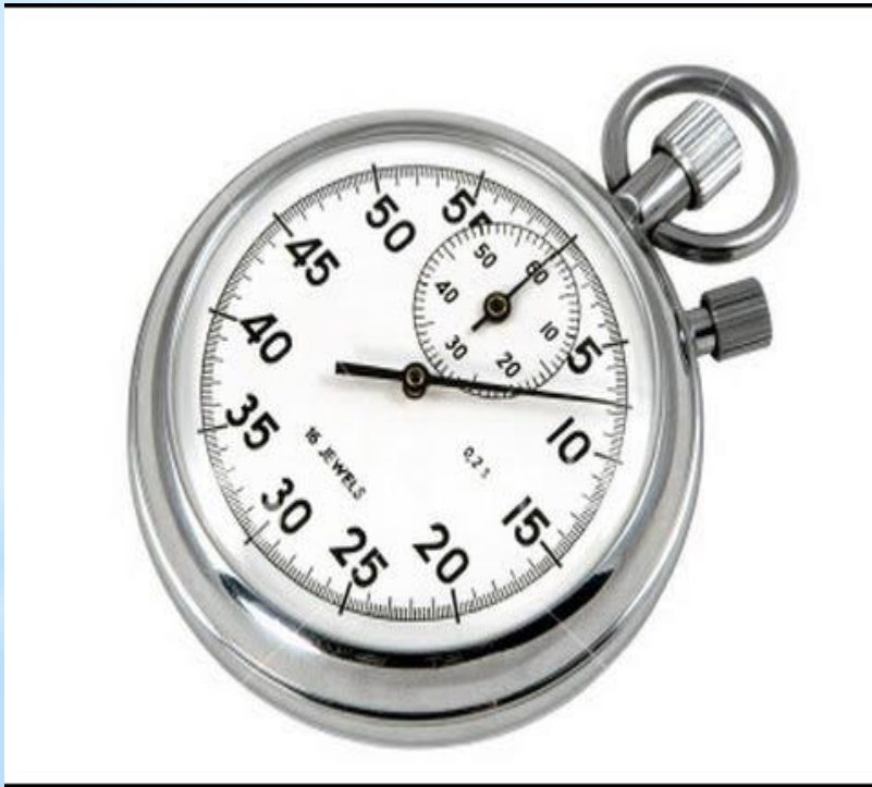
Рис. 24 - Секундомер

СИ: часы, секундомеры, реле времени, ультразвуковые приборы