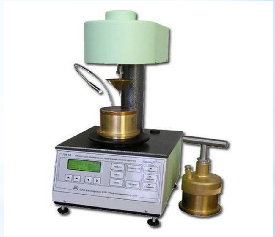
Рис. 13 - Пенетрометр