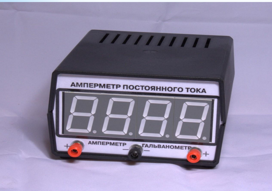
Рис. 22 - Амперметр

СИ: амперметры, вольтметры, омметры, конденсаторы