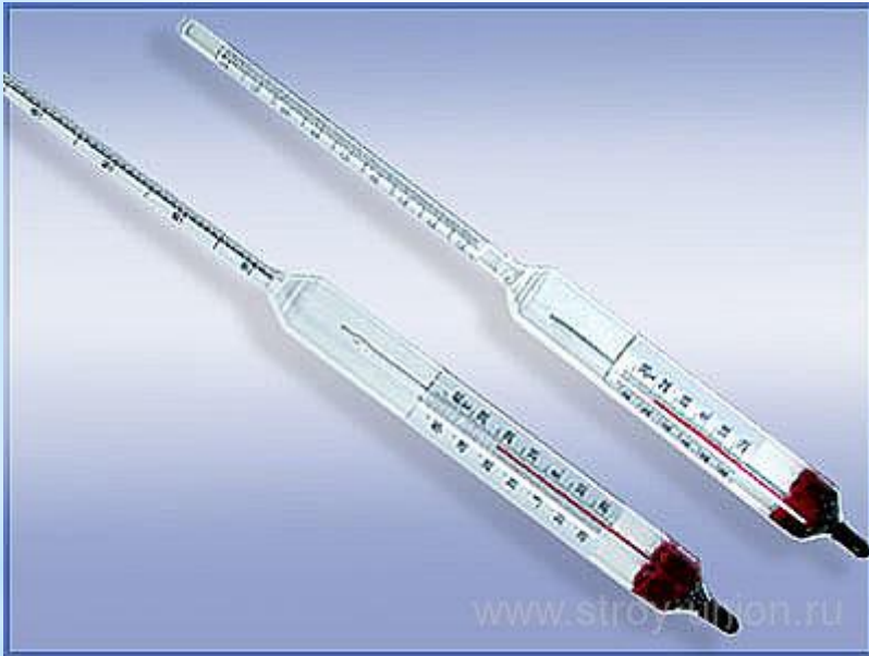
Рис. 9 - Денсиметр