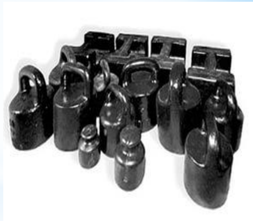
Рис. 6 - Гири