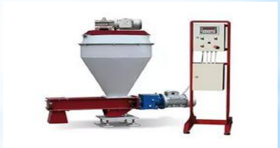
Рис. 27 - Дозатор