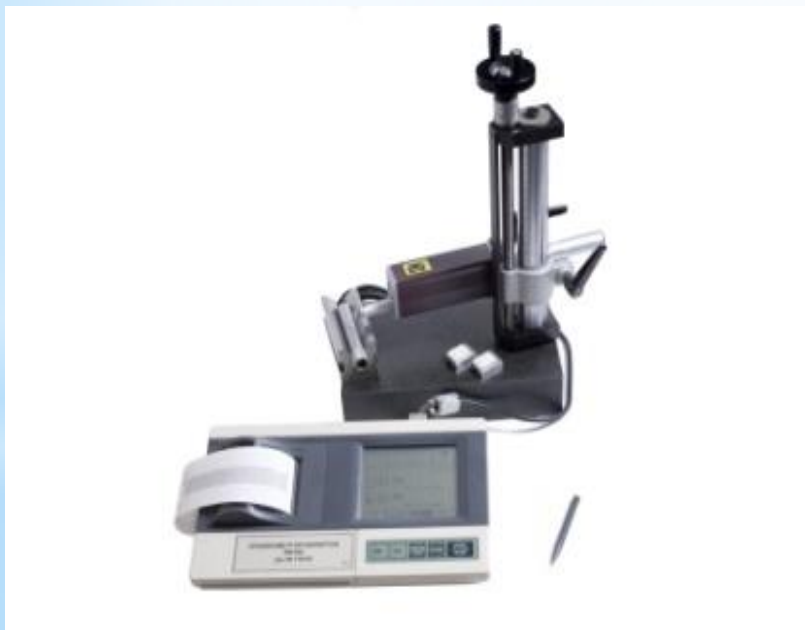
Рис. 3 - Профилограф

СИ: интерферометры, профилографы, микронивелиры, лекальные линейки, плоскомеры, контрольные рейки, уровни, автоколлиматоры