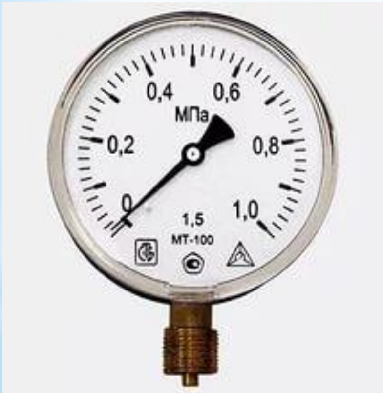
Рис. 28 - Манометр