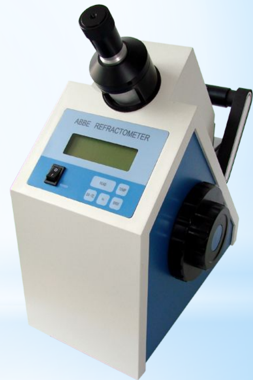
Рис. 19 - Рефрактометр