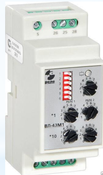
Рис. 25- Реле времени