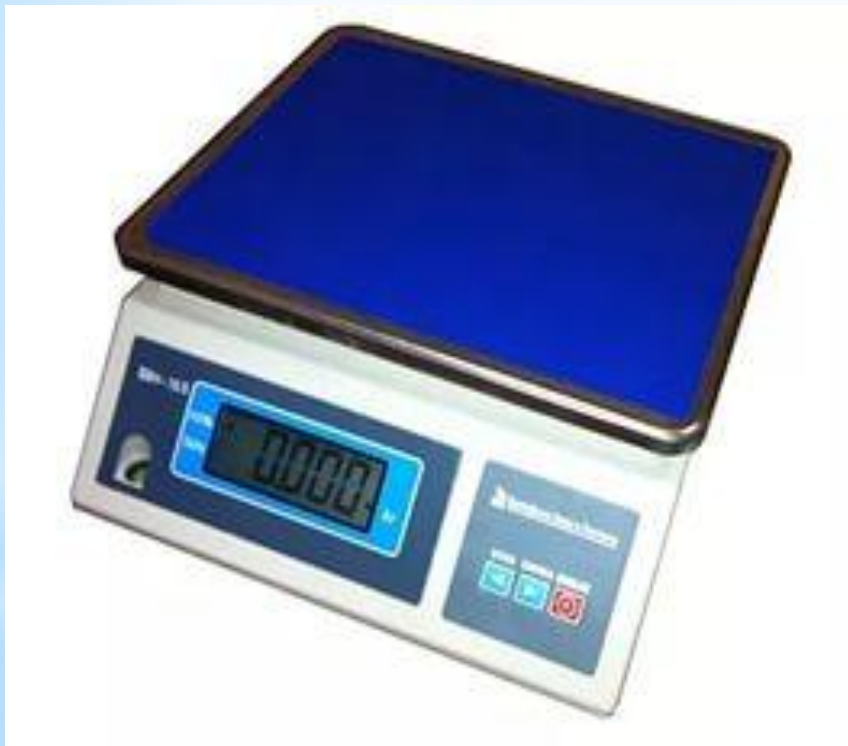
Рис. 5 - Весы