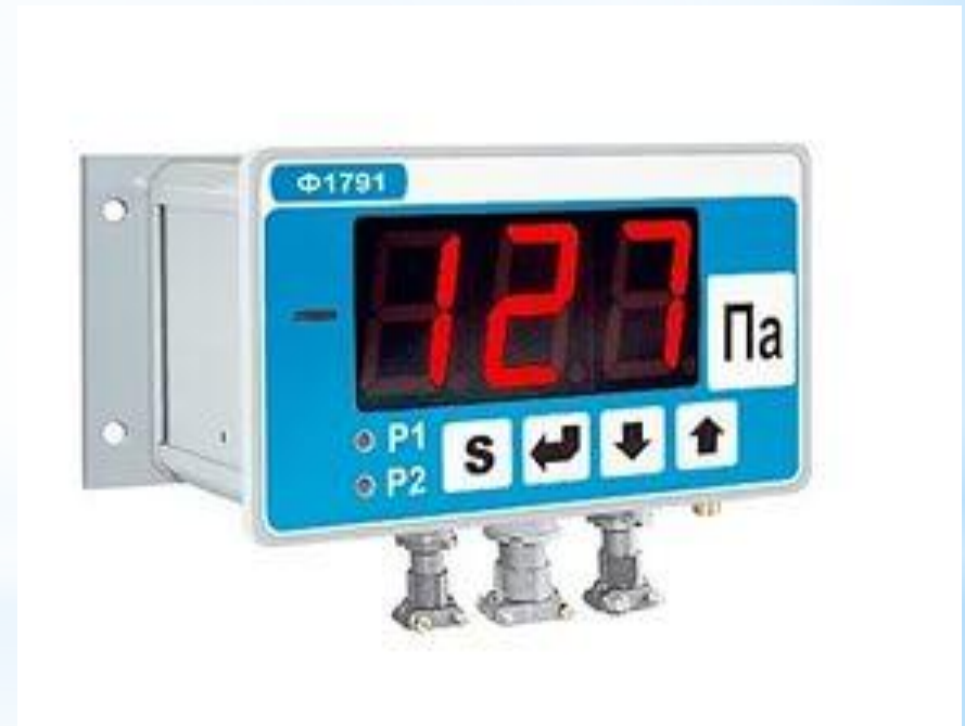
Рис. 29 - Тягомер