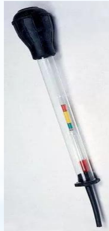
Рис. 10 - Ареометр