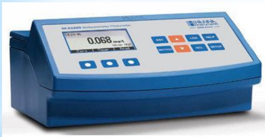
Рис. 16 - Дилатометр