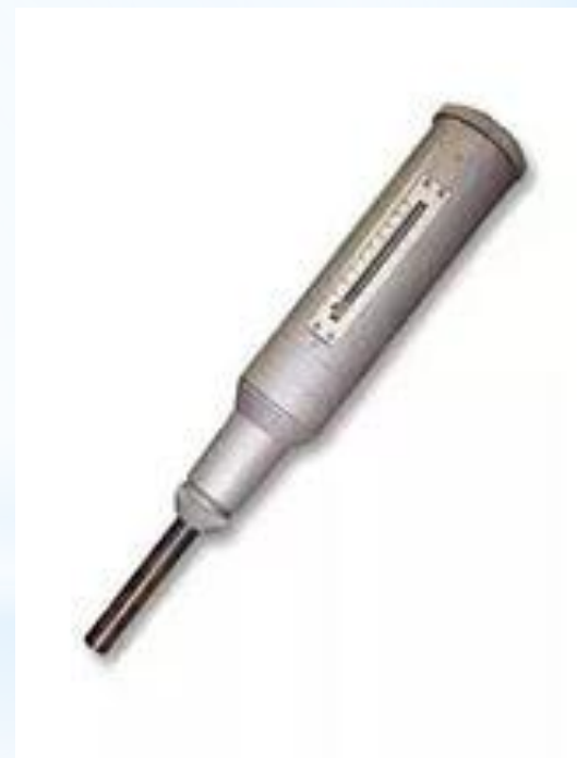
Рис. 8 - Склерометр