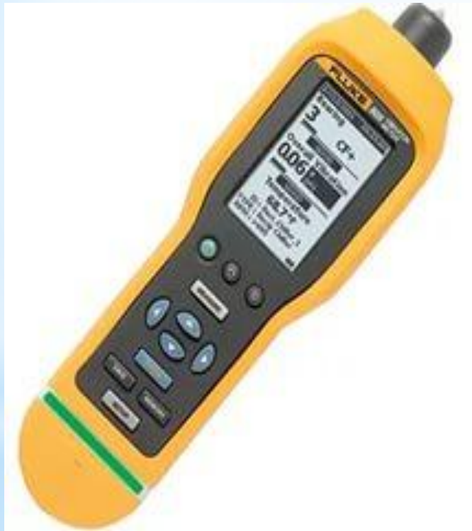
Рис. 20 - Шумомер