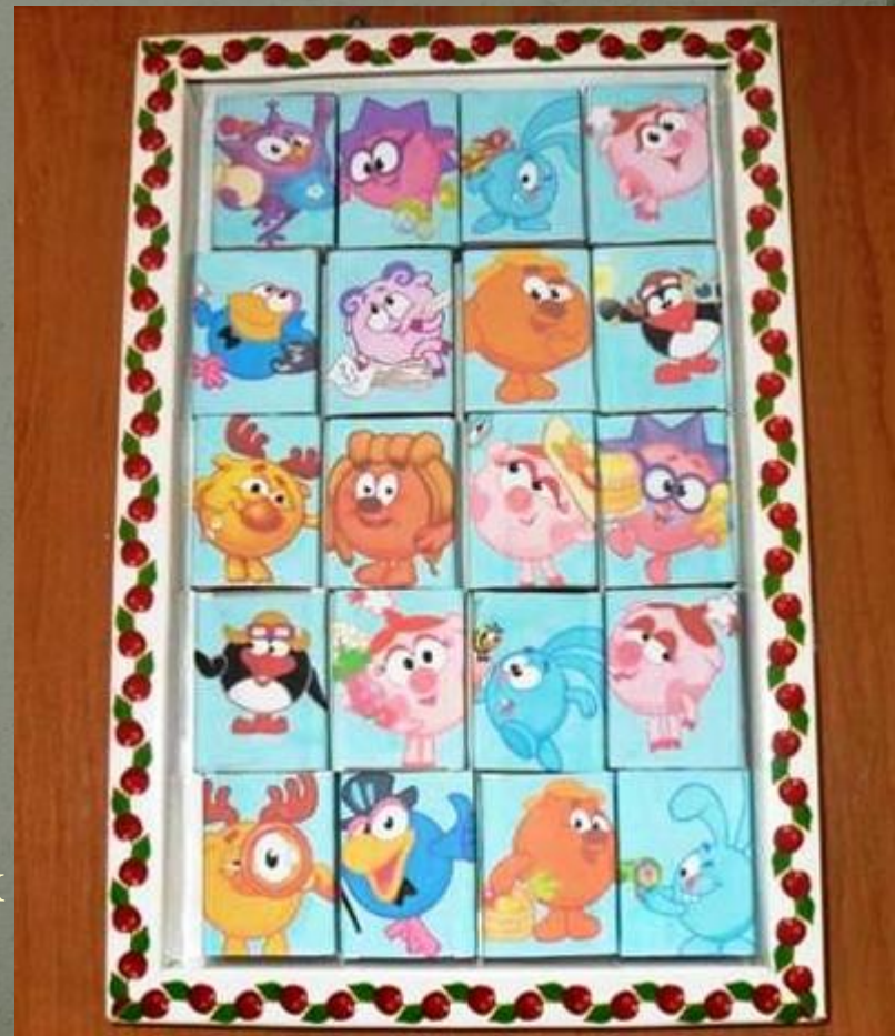
Театр на спичечных коробках