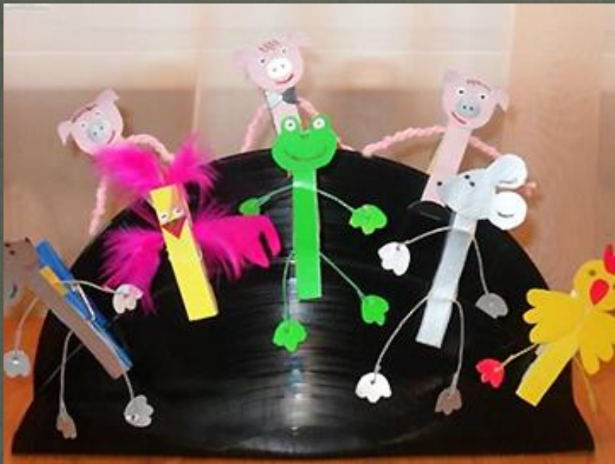
Театр на прищепках