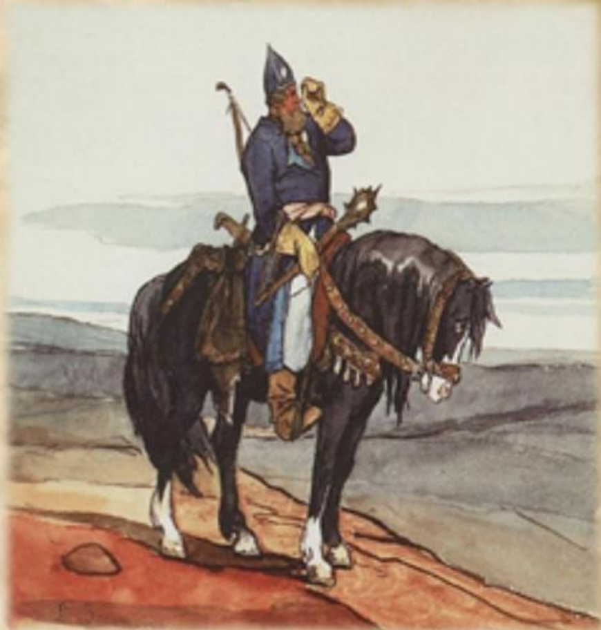
Виктор Васнецов «Богатырь» 1878.