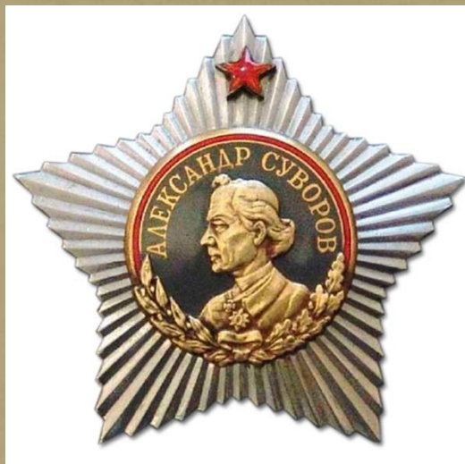
Орден Суворова, им награждали вовремя Великой Отечественно й войны