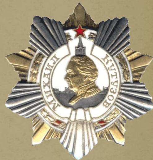
Орден Кутузова, им награждали вовремя Великой Отечественной войны