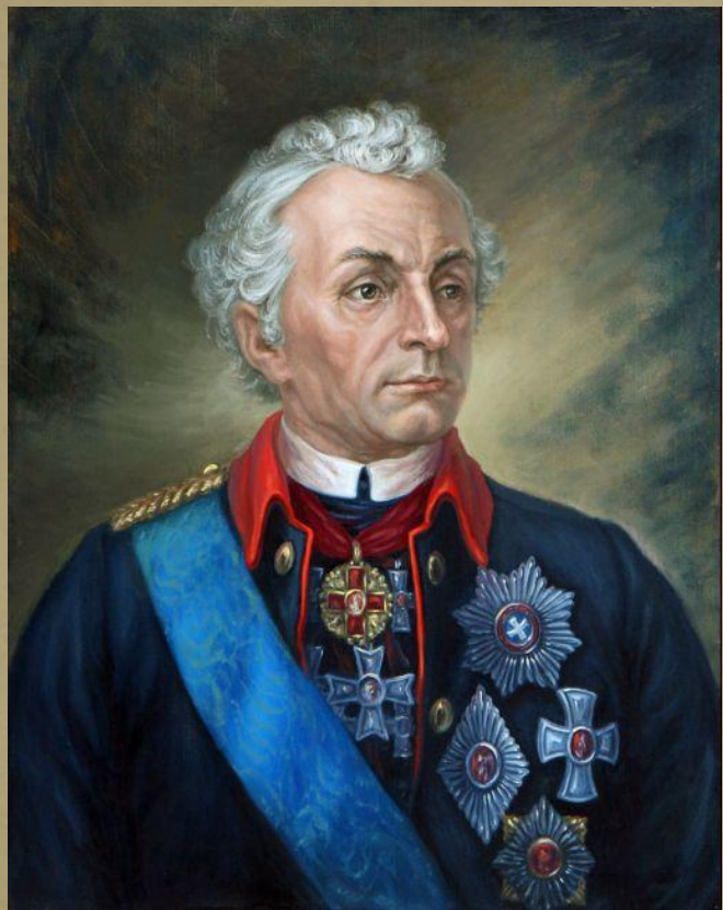
Александр Васильевич Суворов

Назовите русского полководца, который не проиграл ни одного сражения.