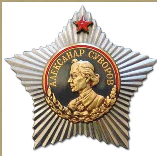
Орден Суворова, им награждали вовремя Великой Отечественно й войны