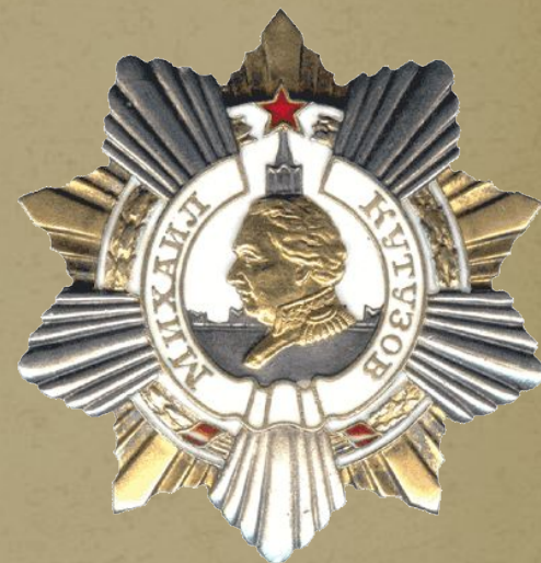
Орден Кутузова, им награждали вовремя Великой Отечественной войны