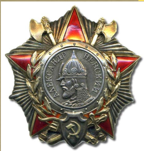
Орден Александра Невского, учрежден в XVIII в.