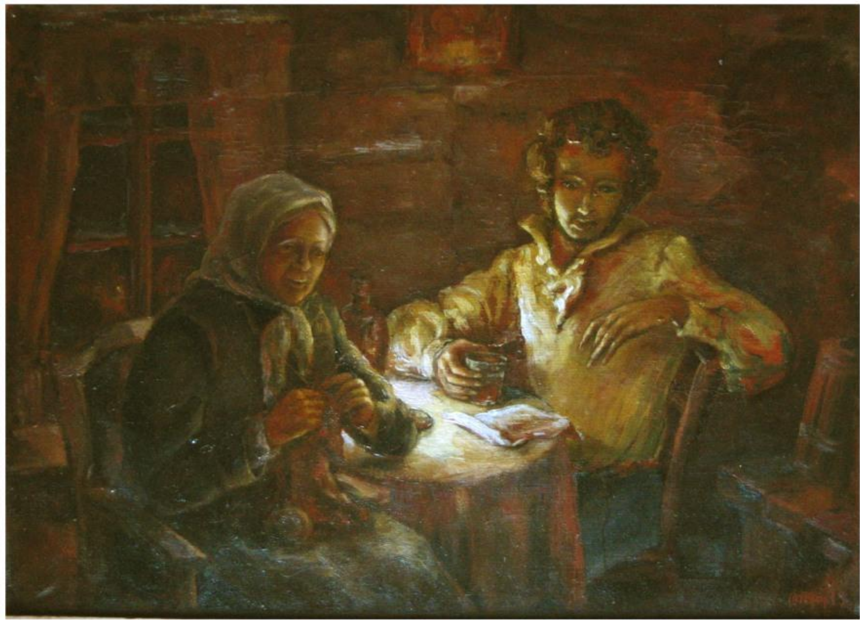
Когда А.С.Пушкин был мальчиком, у него была няня – Арина Родионовна.