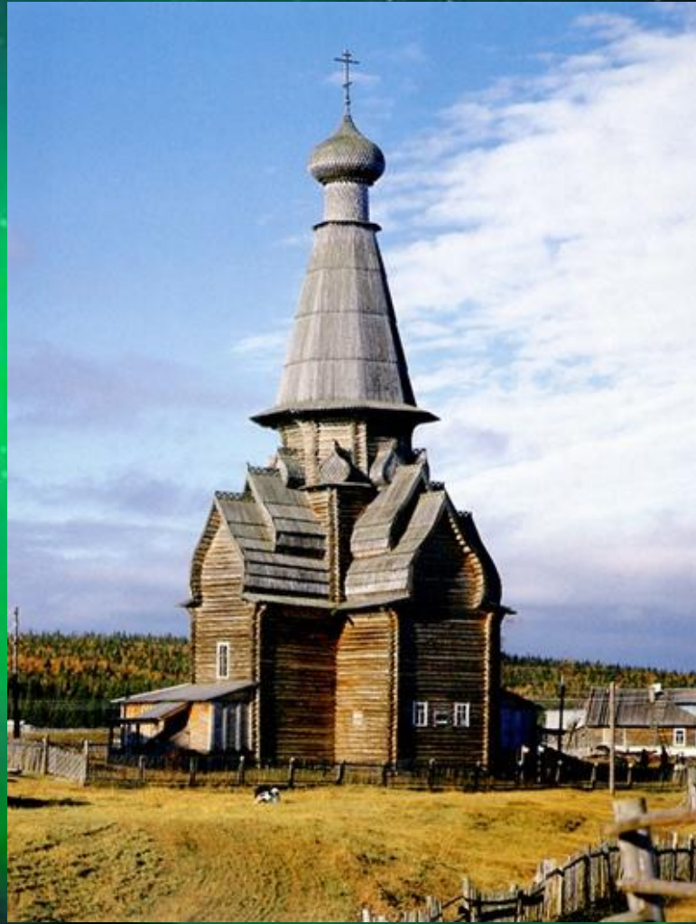
Успенская церковь в Варзуге