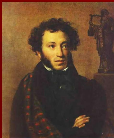
Портрет А.С.Пушкина (1827) О.А. Кипренский