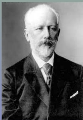
Петр Ильич Чайковский

Великий русский композитор, который написал музыку к балету "Щелкунчик"?