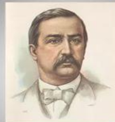
➤ А. П. Бородин (1833 – 1887);