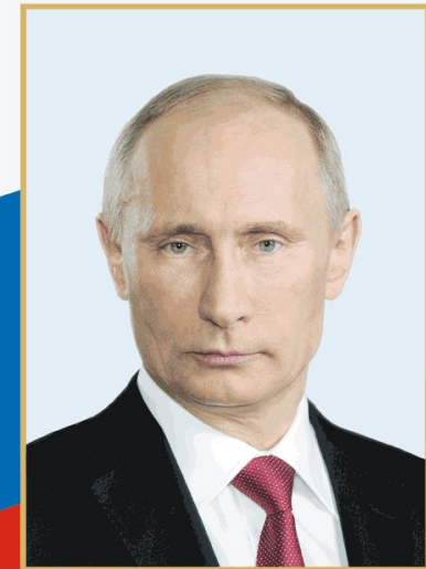
ПУТИН ВЛАДИМИР ВЛАДИМИРОВИЧ Президент Российской Федерации