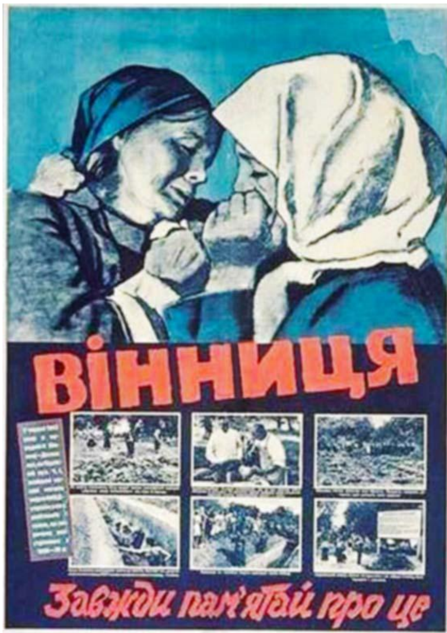
Плакат «Вінниця. Завжди пам'ятай про це»