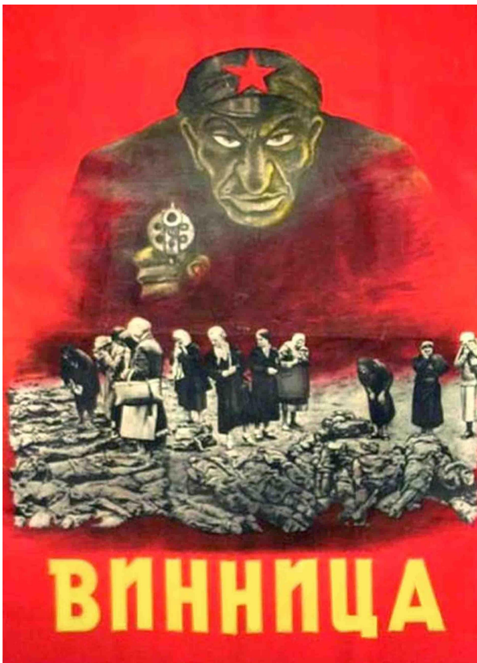
Плакат «Преступления Москвы в Виннице», 1943 год