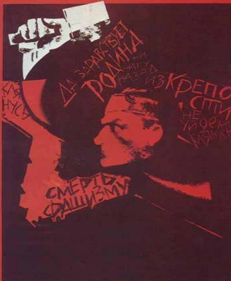
СЛАВА ГЕРОИМ БРЕСТА