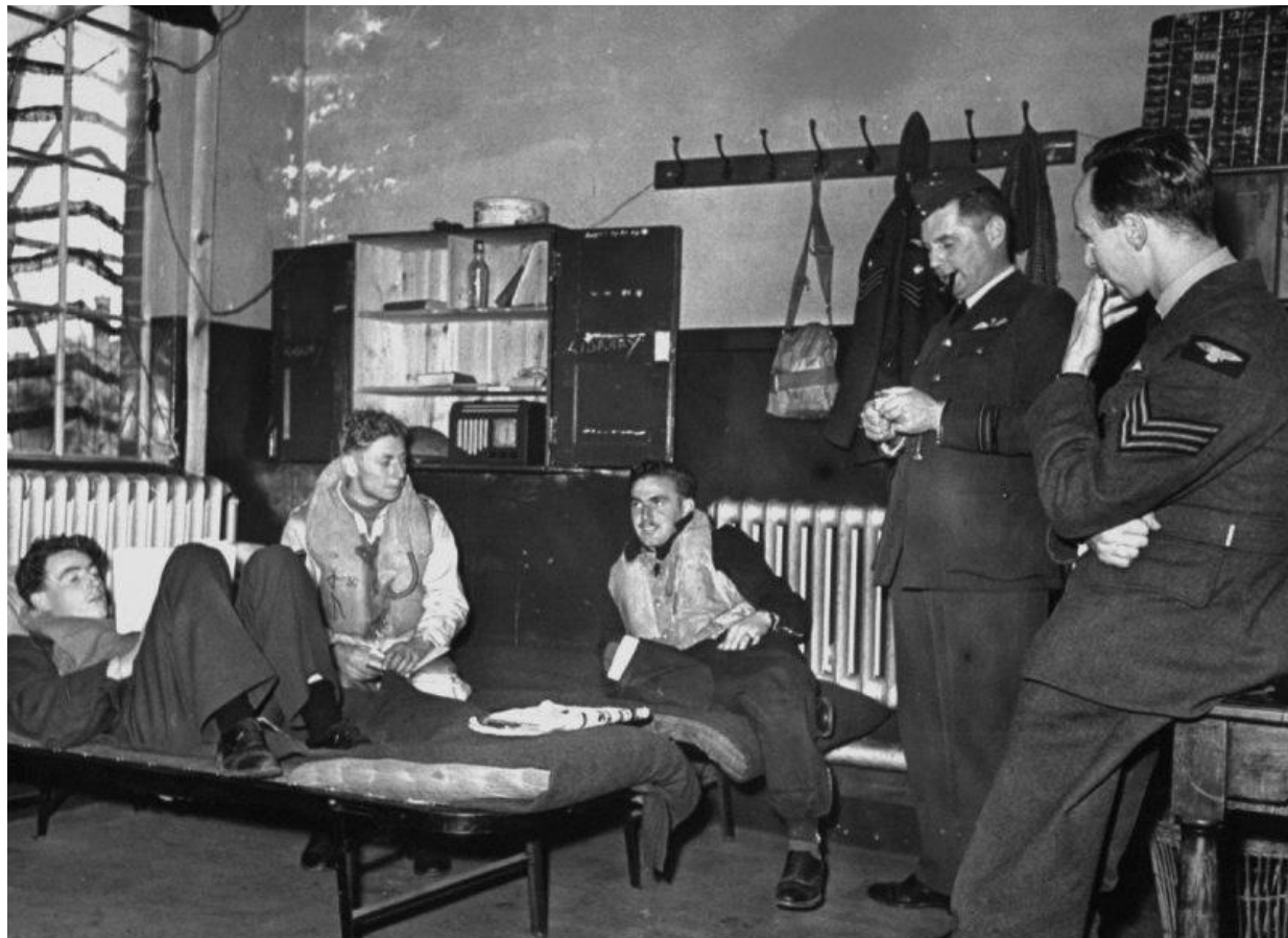
Олег Павлов. Дело Матюшина (1996)

— Кипяточком, кипяточком заваривал! Огонь! Прорвался вдруг чей- то смех. — Это Помогалов чай гоняет, тоже из голубой пить не желает! — Дожили, в карауле кружок нет человеческих. — На- ка, смертник, хлебни... — Чужого не надо, обойдусь.