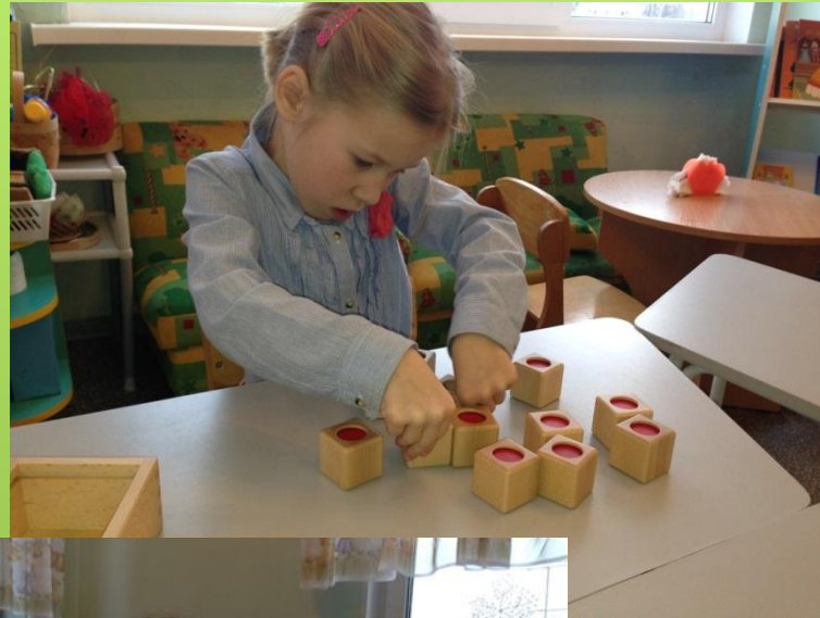
Развивающая игра «Мягче – жестче»