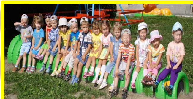
Вас приветствует 2-я младшая группа