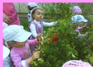
На ягодной полянке