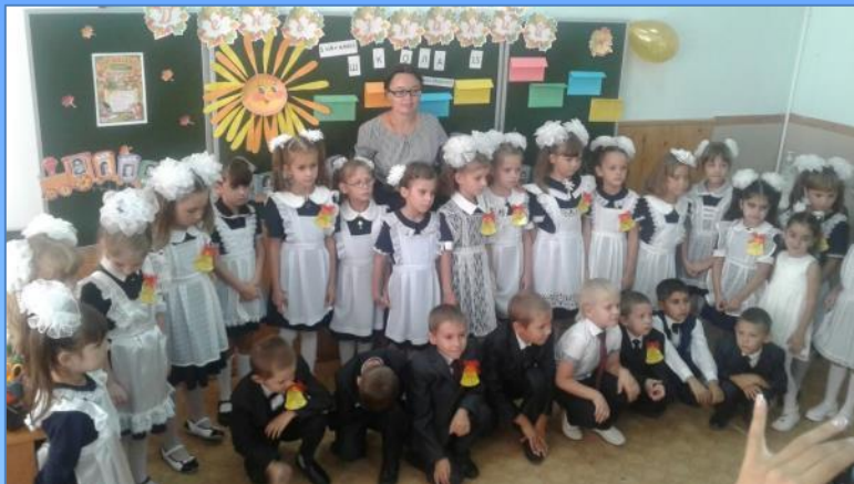
1 «а» (2017-2018 учебный год)