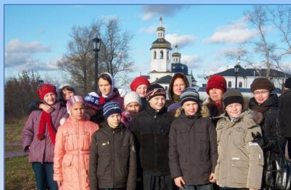
Паломническая поездка с гимназистами в Тобольск