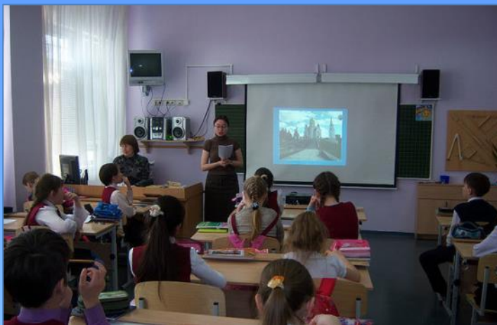
Провожу день православной книги в школе № 1 г. Ханты-Мансийска