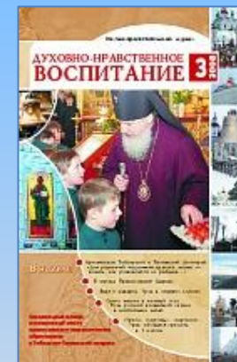
Обложка номера, журнала «Духовно-нравственное воспитание», в котором опубликован мой сценарий праздника «Осень, осень, милости просим»

В это время закончила пединститут, познакомилась с будущим мужем и уехала к нему на Кубань