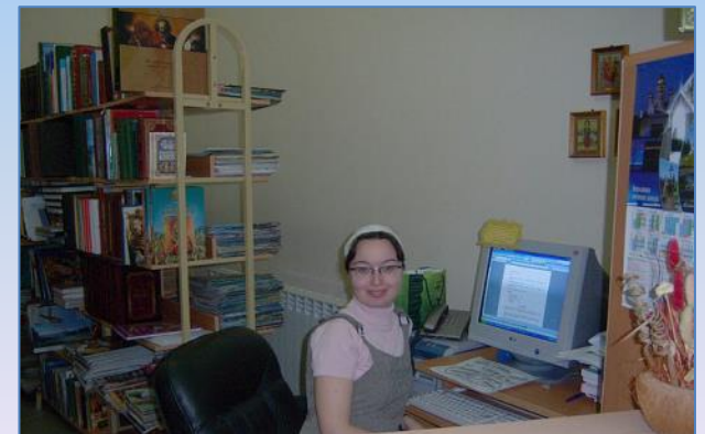
На рабочем месте