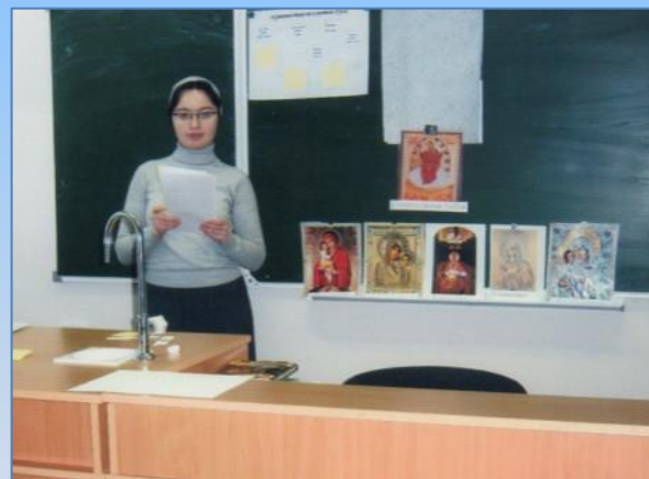
Библиотечный урок «По святой Руси»