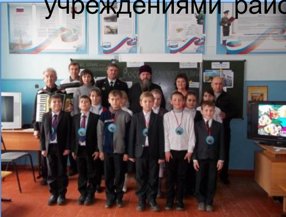
Познавательная игровая программа «России служат казаки» разработана и проведена в МБОУ СОШ № 9 х. Привольный

Сотрудничество воскресной школы с образовательными учреждениями района