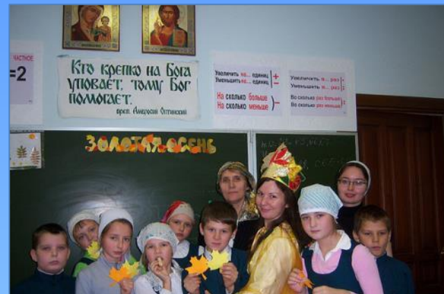
Библиотечный урок «Золотая осень»