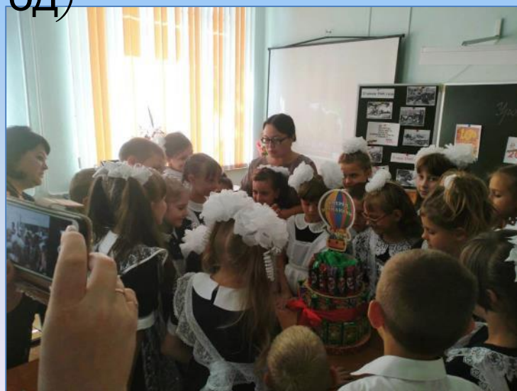
3 «а» (2019-2020 учебный год)