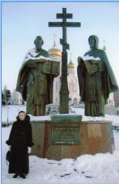
У памятника св. равноапостольным Кириллу и Мефодию

В храмовом комплексе в честь Воскресения Христового я трудилась библиотекарем православной библиотеки храмового комплекса и библиотеки Православной гимназии.