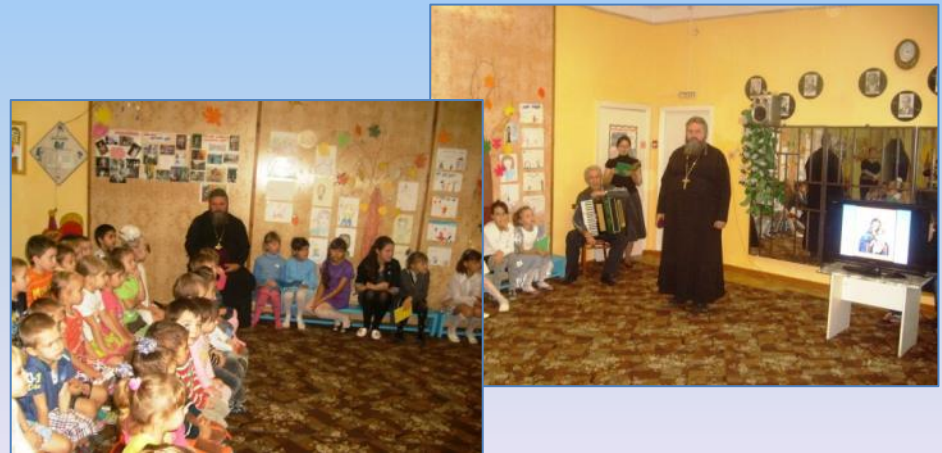
Концерт воспитанников воскресной школы, посвящённый Дню матери (МБДОУ № 31 п. Мирской)