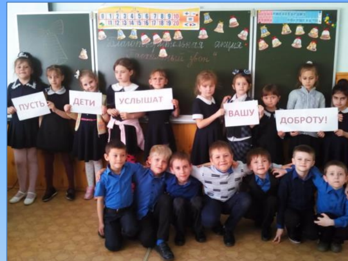
2 «а» (2018-2019 учебный год)