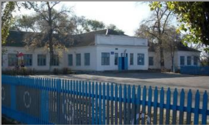
Безымянская средняя школа