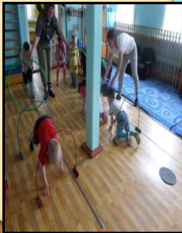
Технология проектного обучения