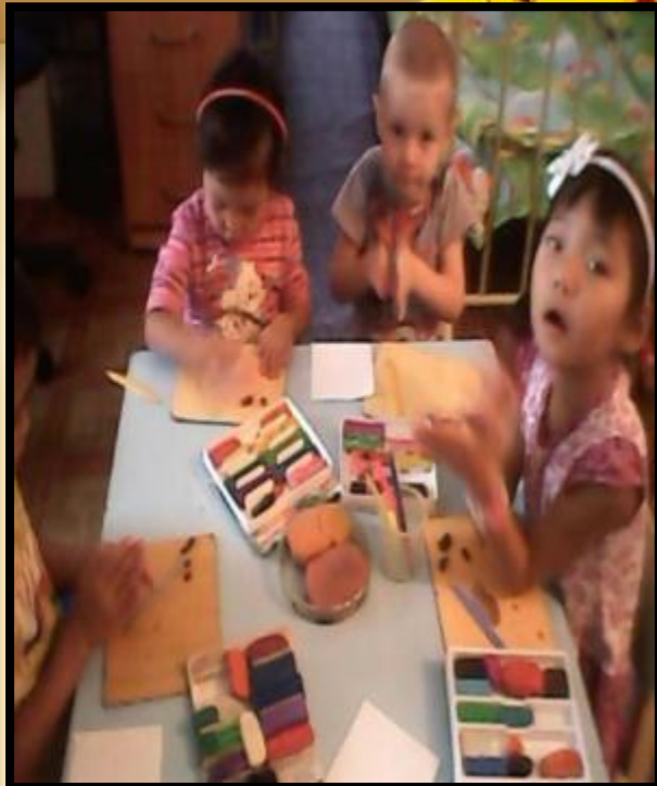
Арт - технология