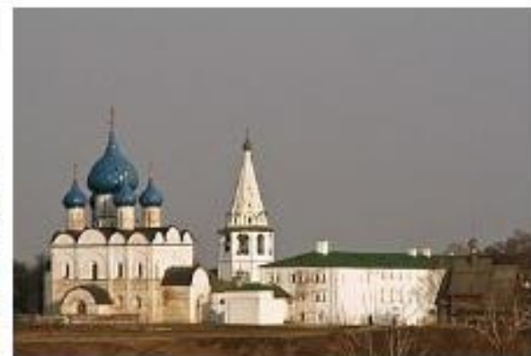
Суздальский кремль с Рождественским собором