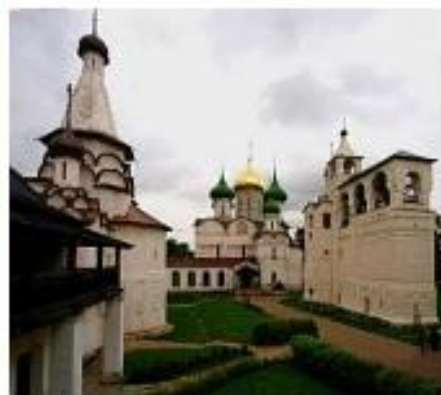
Спасо-Евфимиев монастырь в Суздале