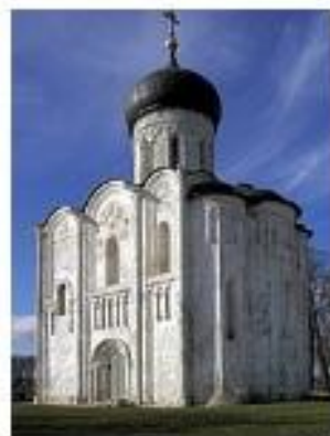
Церковь Покрова на Нерли близ Боголюбова