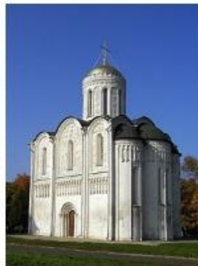
Дмитриевский собор во Владимире