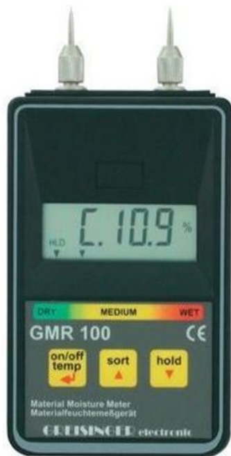
Влагомер, работающий на принципе кондуктометрического метода