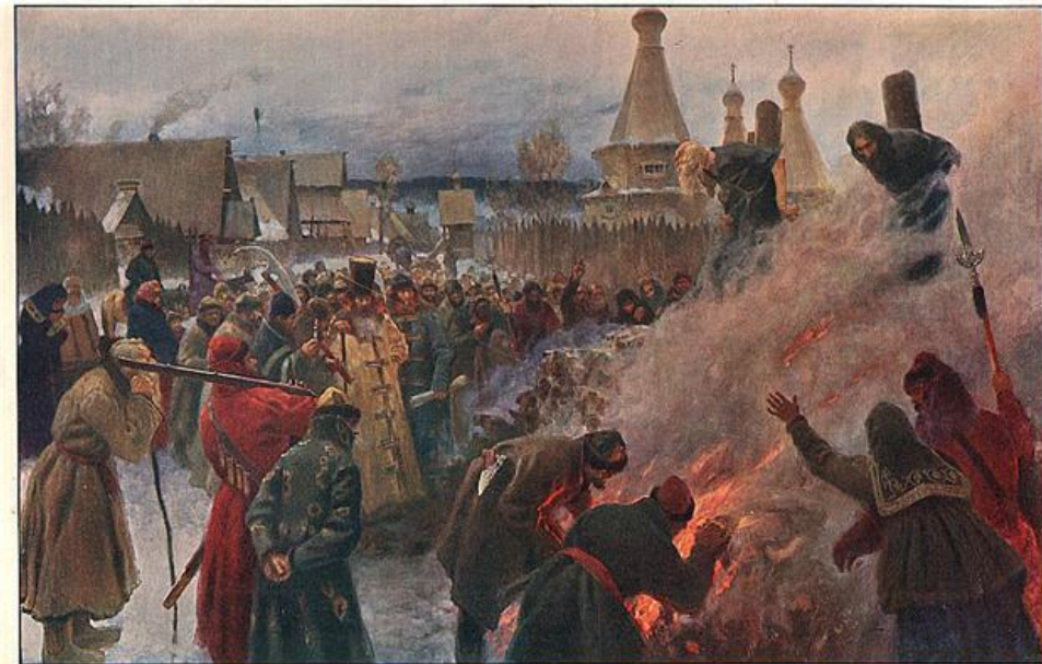
П. Мясо́довъ. Сожже́ние протопопа Аввакума. Музей Императорской Академіи Художеств.