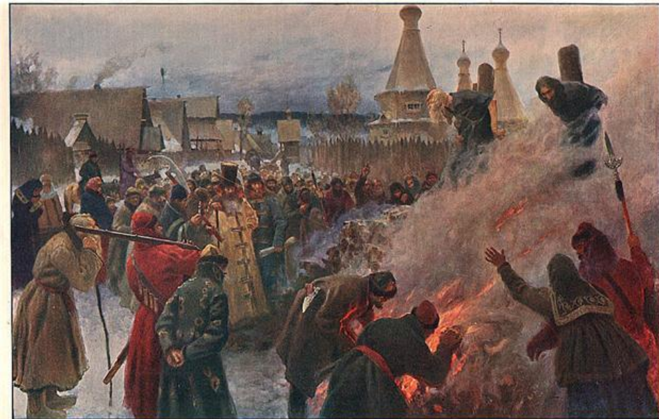
П. Мясоедовъ. Сожженіе протопопа Аввакума. Музей Императорской Академіи Художествъ.