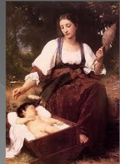
Вильям Бугро Колыбельная

Люли-люли-люленьки, Прилетели гуленьки! Стали гули говорить: "Чем нам Колю накормить?" Один сказал: "Кашкою!" Другой: "Простоквашкою!" Третий сказал: "Молочком Да румяным пирожком".