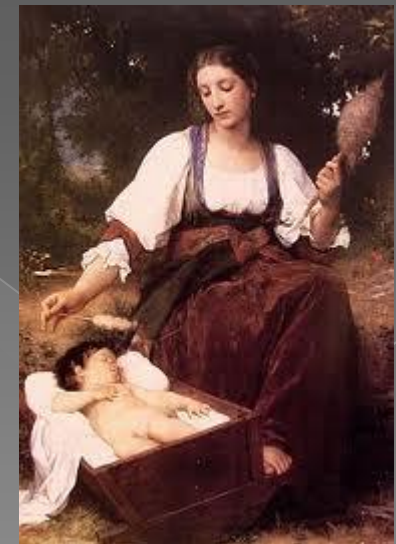
Вильям Бугро Колыбельная

Люли-люли-люленьки, Прилетели гуленьки! Стали гули говорить: "Чем нам Колю накормить?" Один сказал: "Кашкою!" Другой: "Простоквашкою!" Третий сказал: "Молочком Да румяным пирожком".