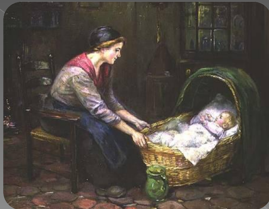
Mother and Child by Cornelis C. Zwaan

Ходит сон по горе, Носит дрему в рукаве. Всем детишкам продает - Нашей Гале так даёт.