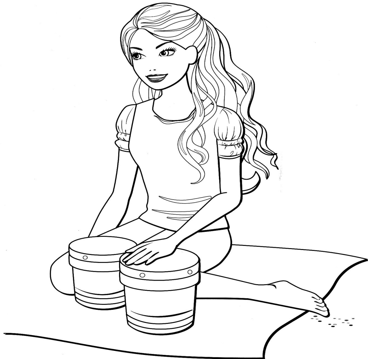
И на барабанах.

Сегодня ученые утверждают, что ребёнок, находящийся ещё в утробе матери уже начинает слышать звуки начиная примерно с девятнадцатой недели. Доказано, что музыка Моцарта обладает терапевтическим и расслабляющим эффектом, причем это чувствует даже еще не рожденный младенец – от звуков музыки этого композитора плод затихает, как бы «прислушиваясь», а после рождения такие дети отличаются более спокойным нравом.