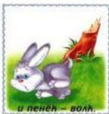
и пенёк — волк.