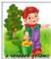
а человек делами.