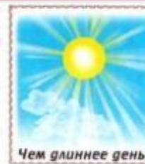
Чем длиннее день,