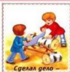
Сделал дело —