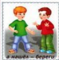
а нашёл — береги.