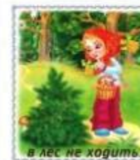
в лес не ходить.