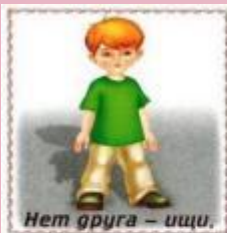
Нет друга — ищи.