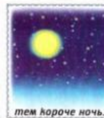
тем короче ночь.