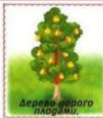
Дерево дорого плодами.