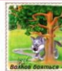
Волнов бояться —