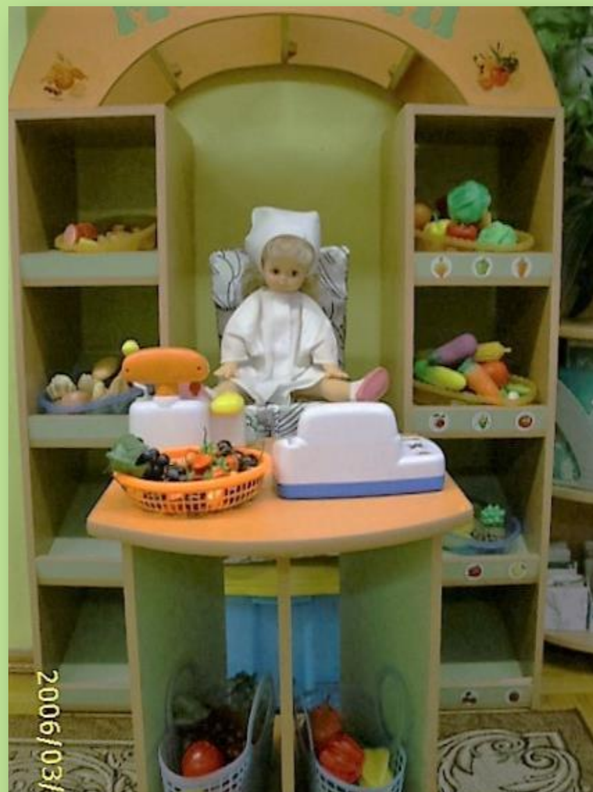
С\Р ИГРА «МАГАЗИН»