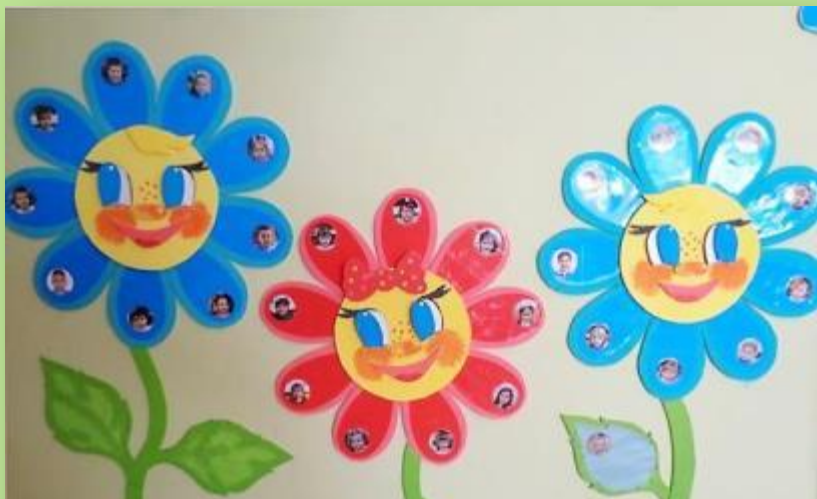
СТЕНД «ПОДЕЛИСЬ ХОРОШИМ НАСТРОЕНИЕМ!»