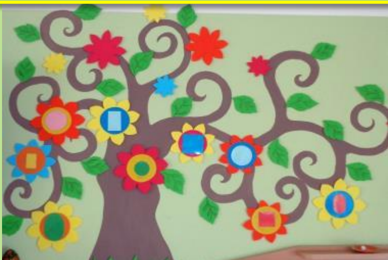
СТЕНД «ВОЛШЕБНОЕ ДЕРЕВО!»