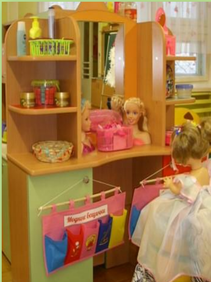
С\Р ИГРА «ПАРИКМАХЕРСКАЯ»