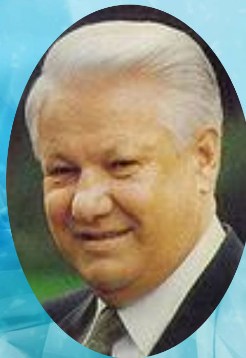
Ельцин Борис Николаевич