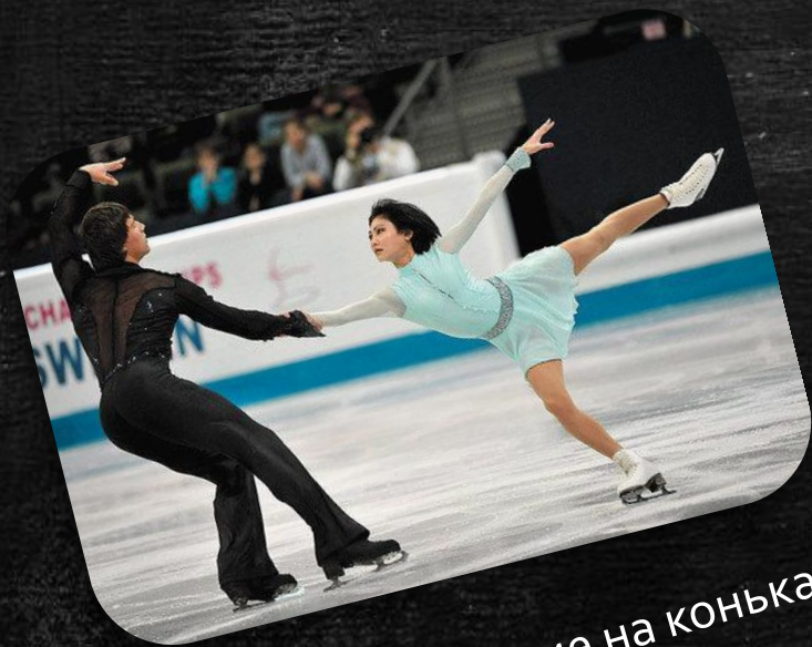
Фигурное катание на коньках