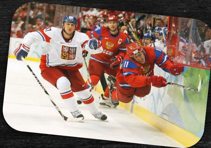
Хоккей на льду