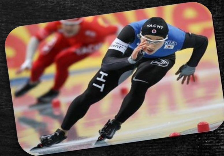
Скоростной бег на коньках