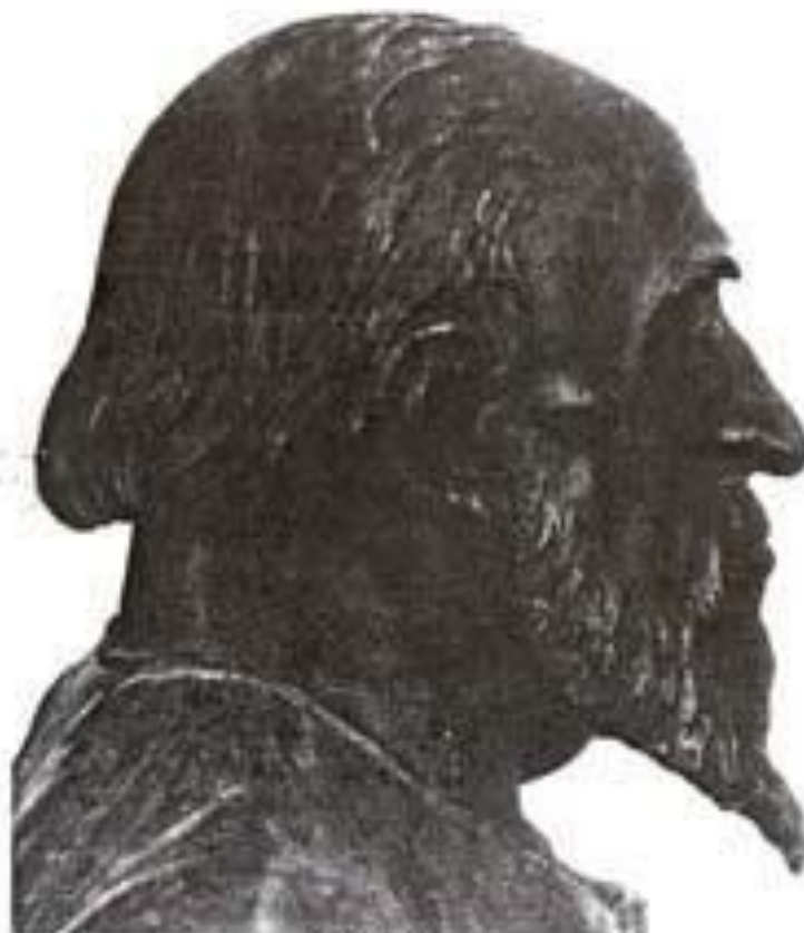
Иван Грозный. Реконструкция М. Герасимова