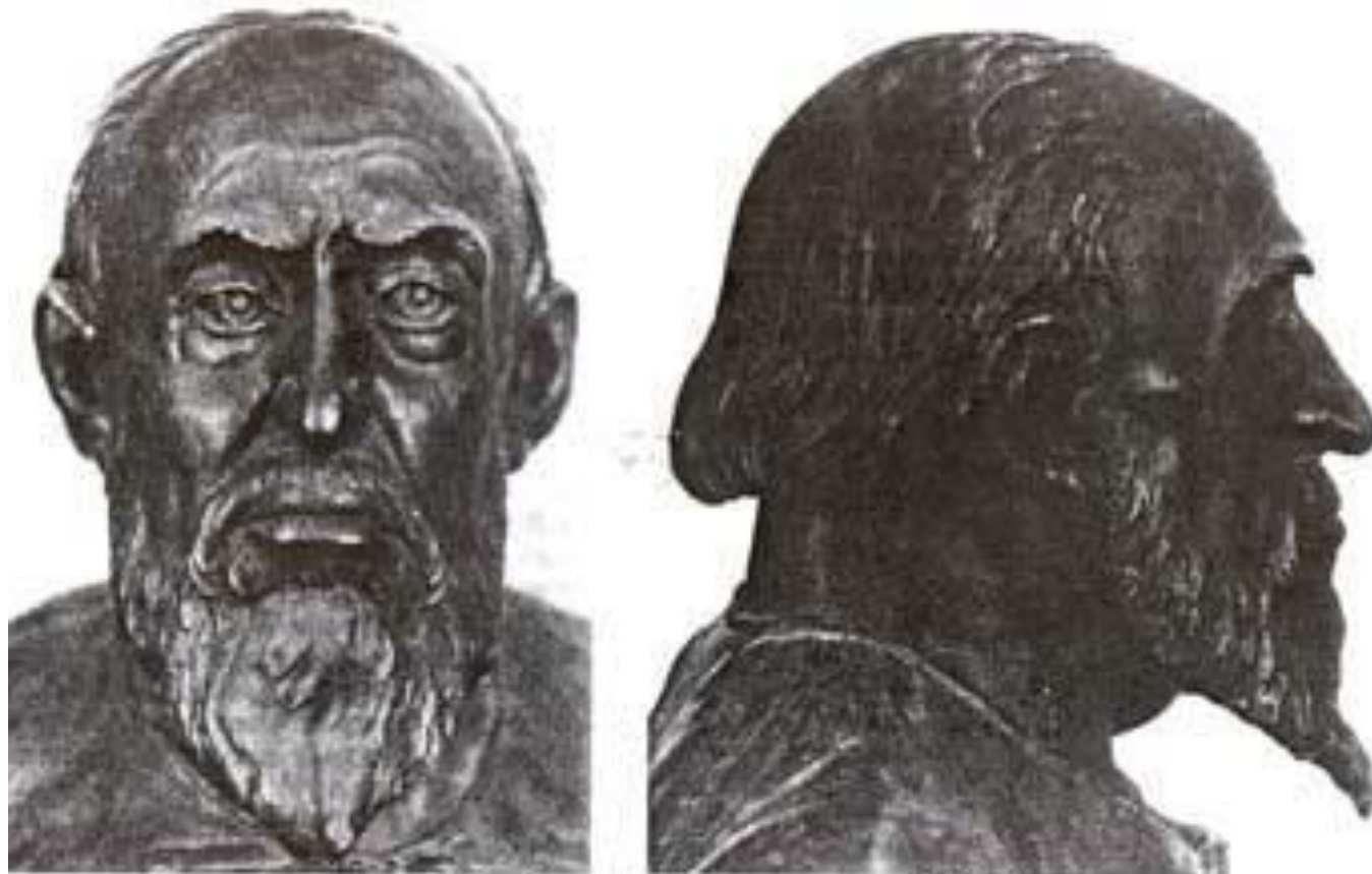
Иван Грозный. Реконструкция М. Герасимова