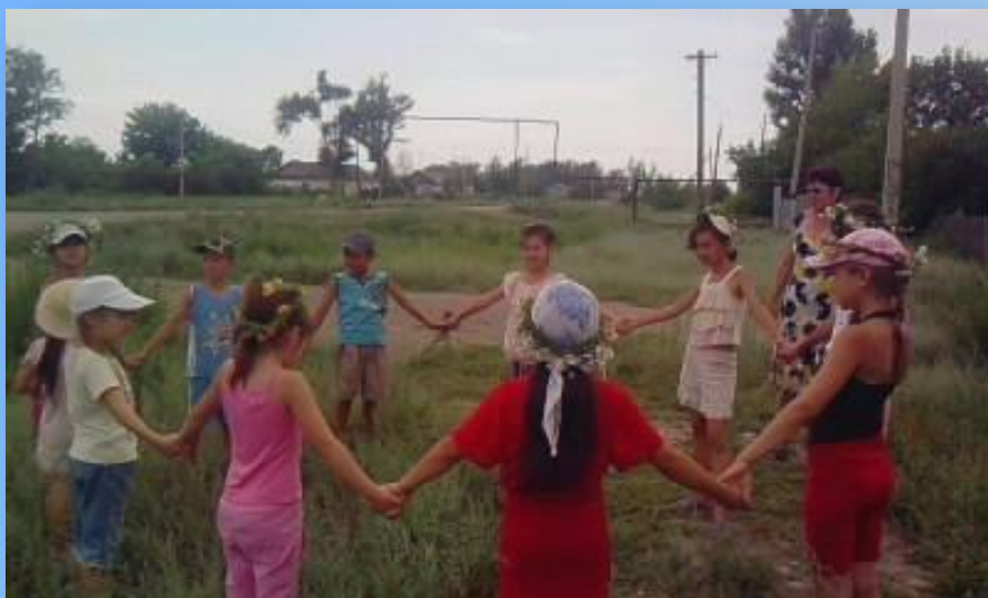
Кружок «Народные игры»