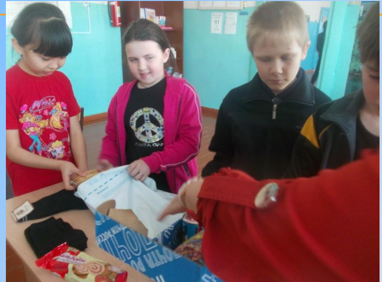
«Тепло родного дома»

Ориентировано на патриотическое, духовно-нравственное воспитание обучающихся. Реализуется через проектную деятельность «Доброе сердце», а также через участие в акциях: «Спешите делать добро», «Тепло родного дома», «Игрушки – детям», проекты «Кормушка»