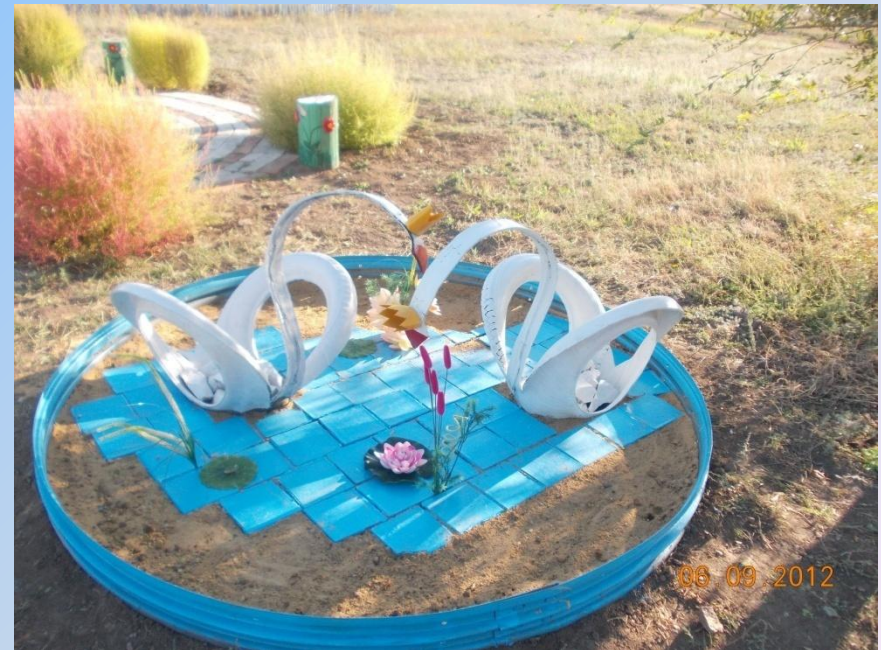
Проект «Лебединое озеро»

В основу организации внеурочной деятельности в рамках социального направления может быть положена общественно – полезная деятельность. Работа в рамках проекта «Мой школьный дворик», «Весенняя неделя добра».