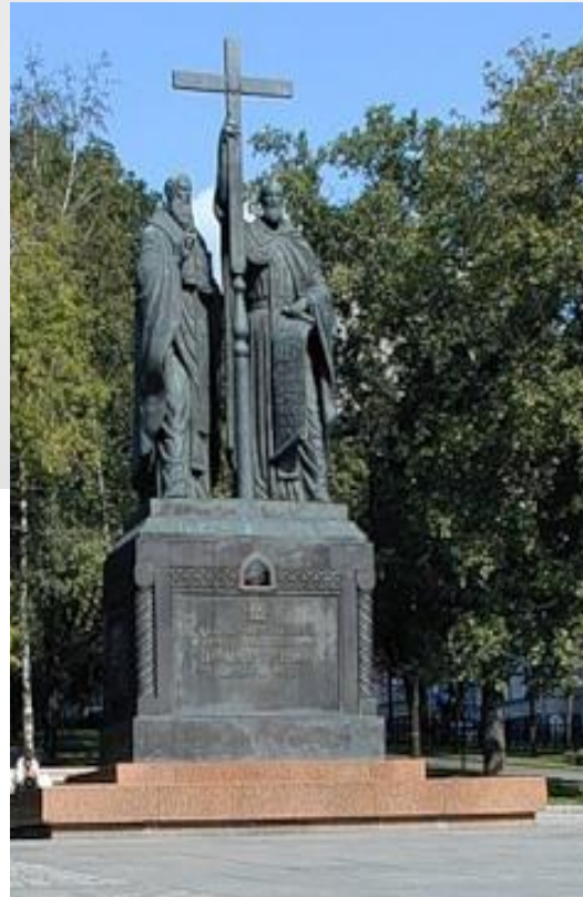
Москва. Славянская площадь