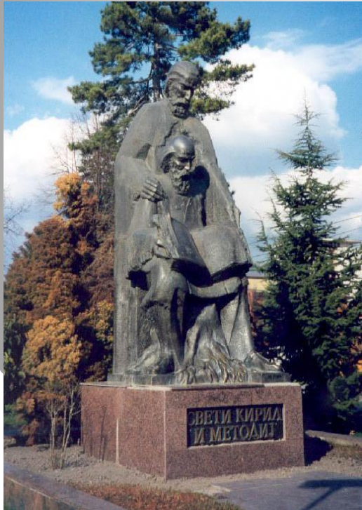
Македония Охрид Памятник Кириллу и Методию