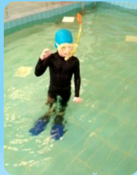
У водолазов свой язык