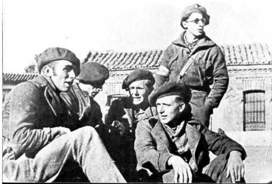
Интернациональная бригада во время гражданской войны в Испании