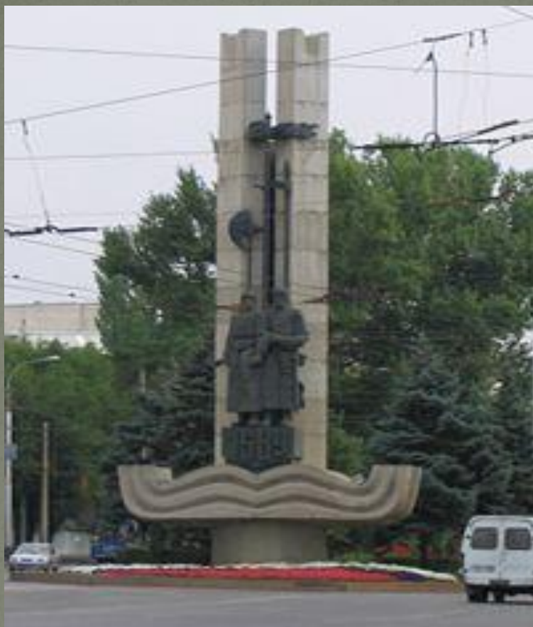
Памятник в честь основания Царицына на пересечении проспекта Ленина и ул. Краснознаменский