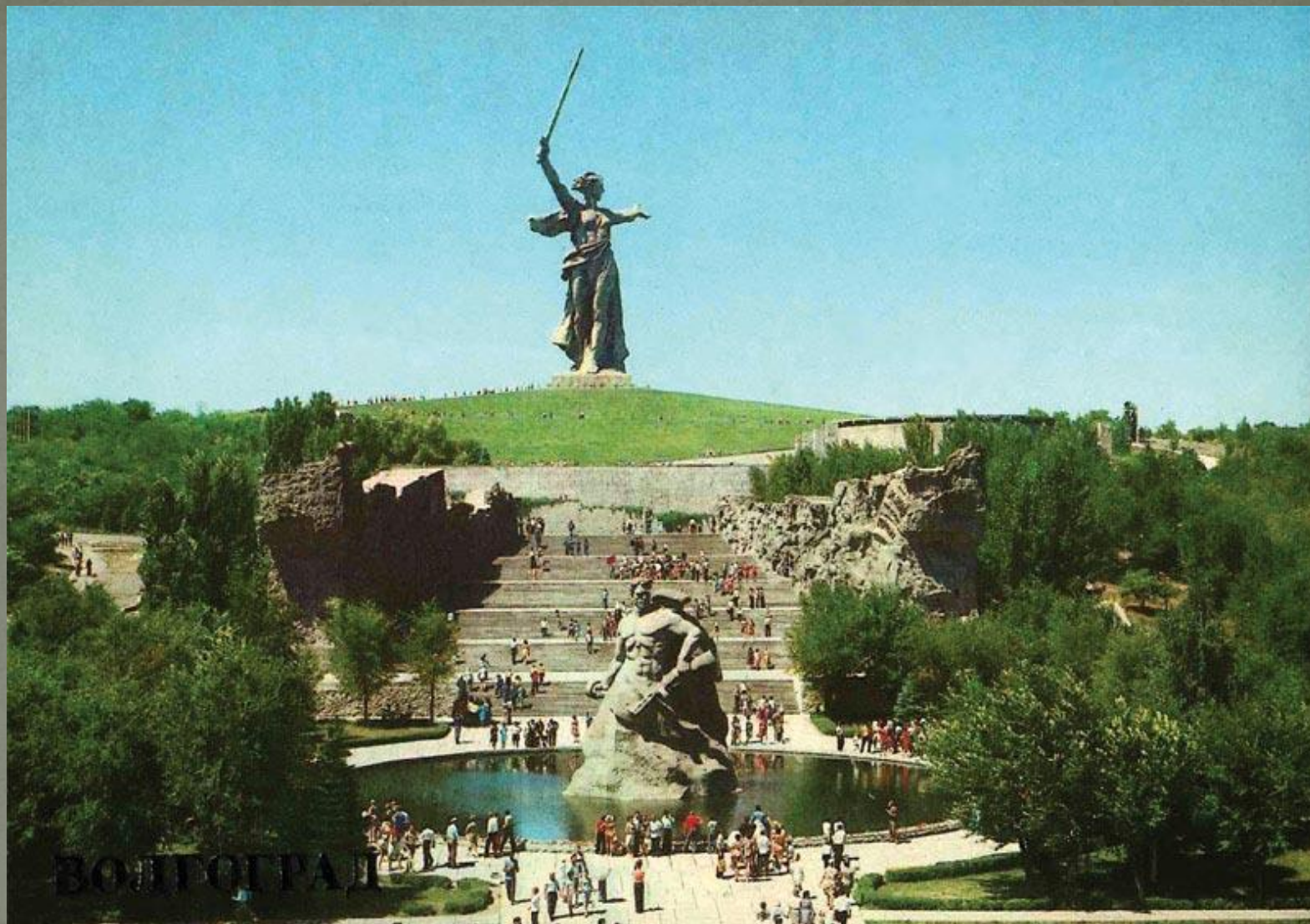
Памятник-ансамбль героям Сталинградской битвы