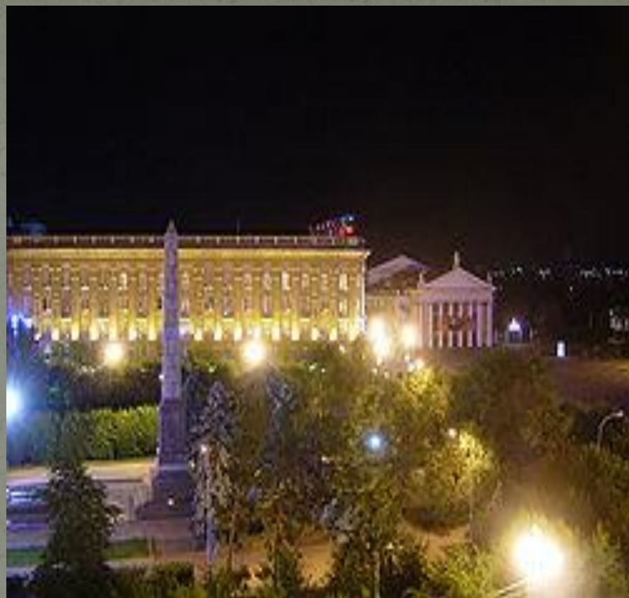
Обелиск защитникам «Красного Царицына» на Аллее Героев