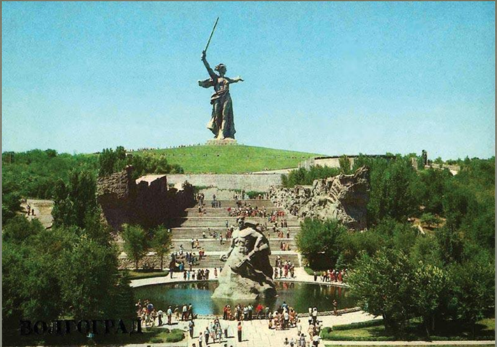
Памятник-ансамбль героям Сталинградской битвы