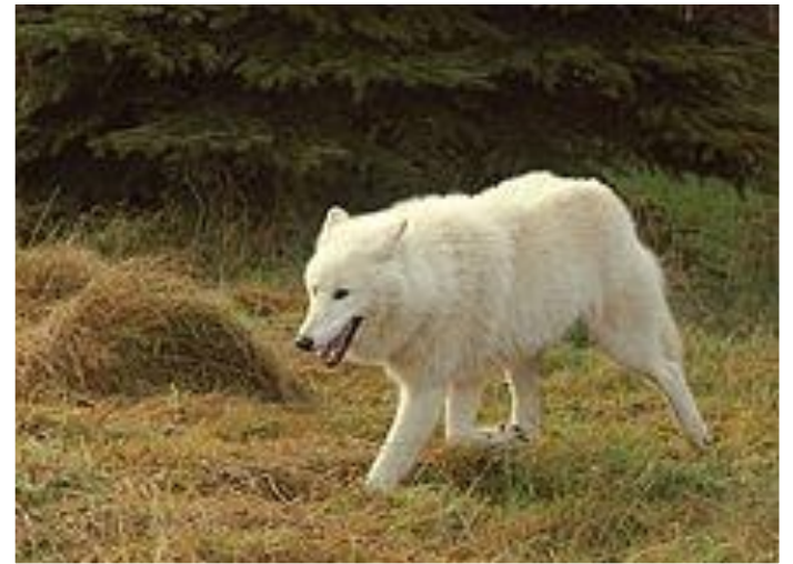
Мелвильский островной ВОЛК

❖ Волк — типичный хищник, добывающий пищу активным поиском и преследованием жертв. Основу питания волков составляют копытные животные: в тундре — северные олени; в лесной зоне — лоси, олени, косули, кабаны; в степях и пустынях — антилопы. Нападают волки и на домашних животных (овец, коров, лошадей), в том числе на собак. Ловят, особенно одиночные волки, и более мелкую добычу: зайцев, сусликов, мышевидных грызунов. Летом волки не упускают случая съесть кладку яиц, птенцов, сидящих на гнёздах или кормящихся на земле тетеревиных, водоплавающих и иных птиц. Часто добывают и домашних гусей. Добычей волков порой становятся лисицы, енотовидные собаки, корсаки; изредка голодные волки нападают на спящих в берлоге медведей.